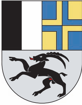
Abbildung 4: Wappen des Kantons Graubünden