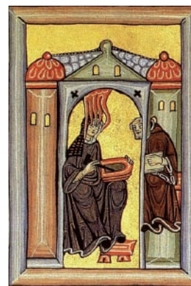
Abbildung 2: Hildegard von Bingen empfängt eine göttliche Inspiration und gibt sie an ihren Schreiber weiter. Miniatur aus dem Rupertsberger Codex des Liber Scivias

Die nächste Aufzeichnung über die heilkundliche Nutzung des Ahorns stammt von Hildegard v. Bingen