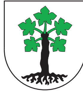
Abbildung 5: Wappen der Gemeinde Trun

etwa 130 Jahren wächst am ursprünglichen Platz ein neuer, aus einem Steckling des Schwurbaumes nachgezogener Ahorn, der die Erinnerung an die lange Eigenständigkeit dieses Volkes wachhält. Das Wappen der Gemeinde Trun zeigt einen stilisierten Bergahorn (Abbildung 5).