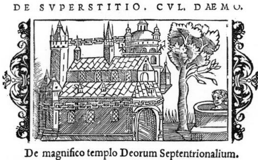
Abb. 4: Der Tempel mit Baum und Quelle in Uppsala; Holzschnitt aus der 'Geschichte der mitternächtigen Völker' (Rom 1544) des Schweden Olaus Magnus

Nahe diesem Tempel steht ein sehr großer Baum, der weithin seine Äste ausbreitet, die im Sommer wie im Winter stets grün sind. Keiner kennt seine Art. Dort befindet sich auch eine Quelle, an der die Heiden zu opfern und in der sie einen lebenden Menschen zu versenken pflegen.