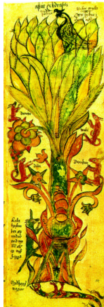
Abb. 3: Die Weltesche Yggdrasil aus einer isländischen Handschrift von 1680 (AM 738 4 ox )

Die Esche ist der größte und beste aller Bäume. Ihre Zweige breiten sich über die ganze Welt aus und erstrecken sich über den Himmel. Drei Wurzeln richten den Baum auf und liegen besonders breit: Eine liegt bei den Asen, die zweite bei den Reifriesen, dort wo einst das Ginnungagap war. Die dritte erstreckt sich über Niflheim, und unter dieser Wurzel liegt Hwergelmir, und Nidhögg nagt an ihrer Wurzel von unten. Aber unter der Wurzel, die sich bei den Reifriesen hinzieht, ist die Quelle Mimirs, in der Klugheit und Verstand verborgen sind. [...] Dorthin kam Allvater und erbat sich einen Trunk aus ihr. Aber er bekam nichts, bevor er sein Auge als Pfand gab. [...] Die dritte Wurzel der Esche liegt im Himmel, und unter ihr ist eine Quelle, die sehr heilig ist. Sie heißt Urdbrunnen. Dort haben die Götter ihre Gerichtsstätte. [...] Dort steht eine prächtige Halle an der Quelle unter der Esche. Aus ihr kommen drei Mädchen, die Urd, Werdandi und Skuld heißen. Diese Mädchen entscheiden über die Lebenszeit der Menschen. Wir nennen sie Nornen. [...] Ein Adler sitzt in den Ästen der Esche, der hat manches Wissen, und zwischen seinen Augen sitzt der Habicht mit Namen Wedrfölnir. Das Eichhörnchen, das Ratatosk heißt, springt an der Esche hinauf und herunter. Zwischen dem Adler und Nidhögg tauscht es Gehässigkeiten aus. Vier Hirsche dringen ins Geäst und beißen die Blätter ab. Sie heißen Dainn, Dwalinn, Duneyr, Durathror. So viele Schlangen sind in Hwergelmir bei Nidhögg, daß keine