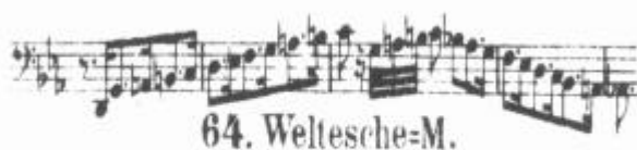
Abb. 2: Das Weltesche-Motiv aus Richard Wagners 'Götterdämmerung'

Schon in dieser Eingangsszene der Götterdämmerung wird durch die dritte Norn in prophetischer Zukunftschau unmissverständlich darauf hingewiesen, dass der von Wotan begangene Baumfrevl letztlich zu einer Katastrophe kosmischen Ausmaßes führen wird. Am Schluss der Oper erfüllt sich diese Prophezeiung. Als sich Brünhild mit ihrem Ross in Siegfrieds brennenden Scheiterhaufen stürzt, um wenigstens im Tod mit ihm vereint zu sein, wird nicht nur die Halle der Gibichungen ein Raub der Flammen, diese lodern vielmehr bis zum Himmel empor und schlagen in die um Walhall aufgeschichteten Scheite der Weltesche (hier klingt in der Oper noch einmal kurz das Weltesche-Motiv auf; Abb. 2). Götter und Helden und damit die ganze alte Welt gehen in diesem gewaltigen Brand zugrunde.