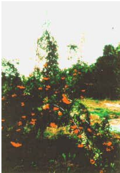
Abb.15: 'Edeleberesche im Vollertrag

aucuparia ) zu den Rosengewächsen (Ordnung: Rosales , Familie: Rosaceae ), zusammen mit dem Speierling ( S. domestica ), der Mehlbeere ( S. aria ), der Elsbeere ( S. torminalis ) und der Zwergmehlbeere ( S. chamaemespilus ) gehört sie zu den heimischen Vertretern der Gattung Sorbus , die in der nördlichen Hemisphäre mit ungefähr 100 Arten vertreten ist. Als Obstpflanze betrachtet, wird die Eberesche zur Kernobstgruppe gezählt, deren wesentliche Vertreter der Apfel, die Birne und die Quitte sind.