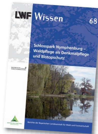
Abbildung 3: Das LWF Wissen 68 »Schlosspark Nymphenburg – Waldpflege als Denkmalpflege und Biotopschutz« zeigt einen Weg auf, wie sich Forstwirtschaft heute bereits in Urban Forestry einbringen kann.

Urbane Wälder und Bäume in der Stadt erfüllen wichtige ökologische und soziale Funktionen. Die großen Herausforderungen, vor denen die Städte stehen, sind der demografische, klimatische und strukturelle Wandel sowie die Globalisierung. Im Vordergrund steht beim städtischen Grün – neben ästhetischen Aspekten – besonders, die Lebensqualität in den Städten zu sichern. Gerade Bäume können Emissionen senken, Lärm mindern, Staub binden und durch ihre Schattenwirkung an heißen Tagen Kühlung bieten. Es ist bekannt, dass Städte mit reichhaltigem Baumbestand attraktiver sind. Bäume und Gehölze im städtischen Grün verbessern die Biodiversität, reduzieren die Luftverschmutzung und mildern den Hitzeeffekt.