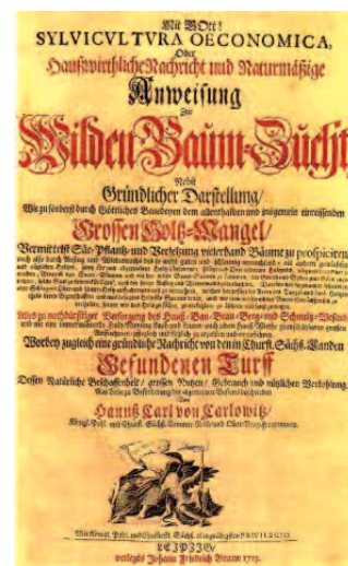
Abbildung 1: Titelbild des Buches »sylvicultura oeconomica« aus dem Jahr 1713 von Carlowitz; das Programm des Buches ist in roter Schrift hervorgehoben.

In keinem Bereich aber wird dieser Begriff so authentisch verwendet wie in der Forstwirtschaft. Es ist kein Zufall, dass dieser Begriff und das ihm zugrunde liegende Denken im Wald geboren wurden. Hier, im Wald, geht es um umfassende Ressourcen, um lange Zeiträume, hier treffen Ökonomie und Ökologie unmittelbar aufeinander, hier sind ihre Ansprüche direkt und konkret auszugleichen.