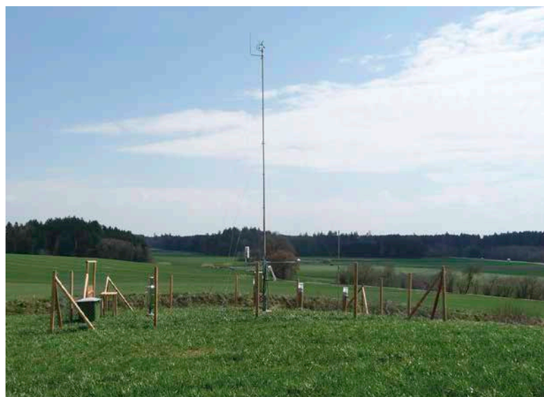
Freifläche mit Wetterstation der WKS Höglwald