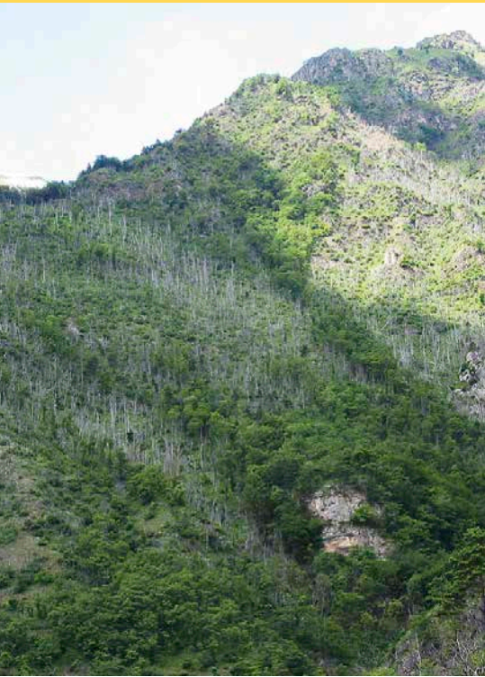
Typisches Bestandesmosaik eines durch Brand geschädigten montanen Buchenwaldes. Stark brandgeschädigte Bereiche, in denen kaum eine Buche überlebt, sind benachbart zu schwach geschädigten Partien mit noch fast vollständig intakten Kronenschlüsseln.