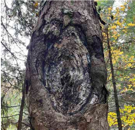
Konzentrische Kallusbildung um die Eintrittspforte mit nekrotischen Bereichen bei vorangeschrittenem Eutypella–Stammkrebs

Seit einigen Jahren verursacht die Ahorn-Rußrindenkrankheit in warm-trockenen Regionen Bayerns teils bestandsbedrohende Schäden an Bergahorn. Im niederschlagsreicheren Süden des Landes wurde nun eine weitere eingeschleppte, forstwirtschaftlich relevante Erkrankung an der Gattung Ahorn entdeckt. Der Pilz Eutypella parasitica verursachte an Bäumen im Stadtgebiet Münchens sowie in umliegenden Auwäldern der Isar teils großflächige Krebswucherungen und Stammdeformationen. Betroffen war vor allem Bergahorn, aber auch an weiteren eher gartenbaulich