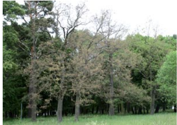
Abbildung 6: Kahlfraß an Eiche durch den Eichenprozeptionsspinner. Der Eiche verbleibt nur wenig Restbelaubung. Ein massiver Verlust an Reservestoffen ist die Folge.

Schwerwiegender wirkt sich der Fraß des Schwammspinners und des Eichenprozeptionsspinners aus, da der Fraß deren Raupen je nach Witterung bis Ende Juni andauert und damit auch den Johannistrieb der Eichen betrifft. Zur Bewertung der Schäden sind mehrere Aspekte zu beachten. Bei mehr als 25 % Entlaubung tritt bereits ein Zuwachsverlust ein (Fratzian 1973). Das Problem liegt jedoch nicht in erster Linie im Holzverlust für den Waldbesitzer, sondern viel-