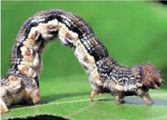
Abbildung 2: Eine Raupe des Großen Frostspanners. Sie wird bis zu 35 mm lang und ist nur im Mai und Juni zu finden.