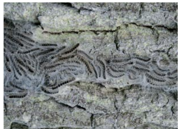
Abbildung 4: Raupen des Eichenprozessionspinners, die sich auf einer Prozession Richtung Krone befinden

Der wärmeliebende Eichenprozessionsspinner ( Thaumetopoea processionea L.) ist bei uns ursprünglich ein Insekt des Offenlandes. Er trat zunächst vor allem an einzeln stehenden Eichen in Parkanlagen, an Alleen, auf Parkplätzen, an Waldrändern und in