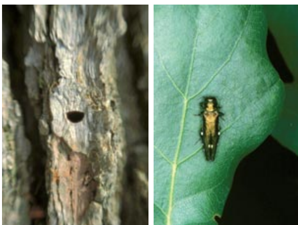
Abbildung 5: Links: D-förmiges Ausbohrloch eines Zweipunkt-Eichenprachtkäfers. Rechts: Imago des Zweipunkt-Eichenprachtkäfers. Deutlich sind die zwei namensgebenden Punkte auf den Deckflügeln sichtbar.

Der Zweipunkt-Eichenprachtkäfer ( Agrilus biguttatus F.) ist ein 8 bis 13 mm langer Käfer und lebt vor allem in wärmebegünstigten Eichenwäldern (Brechtel und Kostenbader 2002). Er gehört zur Familie der Prachtkäfer