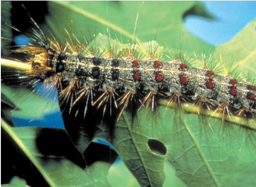
Abbildung 3: Raupe eines Schwammspinners

Der Schwammspinner ist von England bis Japan verbreitet. Die Südgrenze in Europa bildet das Mittelmeer und die Nordgrenze eine Linie von Mittelschweden nach Moskau (Novak et al. 1986). Im Jahr 1869 wurde er nach Amerika eingeführt, um eine kommerzielle Seidenquelle zu besitzen (Dixon und Foltz 1985). Bis Mitte des 20. Jahrhunderts hatte er sich über die gesamten USA ausgebreitet und gilt dort inzwischen als gefürchteter Schädling (Novak et al. 1986).