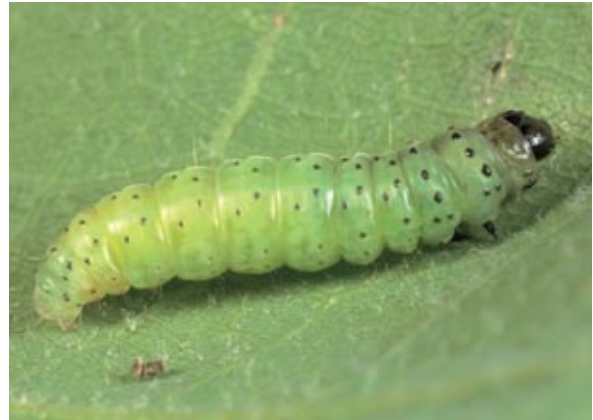
Abbildung 1: Raupe des Grünen Eichenwicklers. Auffällig sind der schwarze Kopf sowie die schwarzen Warzen mit den Härchen. Die Raupe wird bis zu 20 mm lang.

Die Flügelspannweite der männlichen Falter des Kleinen Frostspanners beträgt bis zu 30 mm. Die Flügel sind gelblich braun gefärbt mit welligen Querbinden. Die Spannweite der männlichen Falter des Buchen-Frostspanners beträgt bis zu 36 mm und die Färbung ist etwas heller als die des Kleinen Frostspanners (Schwenke 1978).