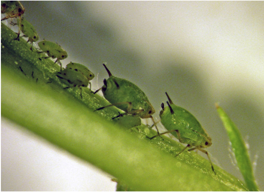
Abbildung 2: Die Grüne Apfelblattlaus, Aphis pomi , als Vertreter einer Phytophagengruppe (Blattläuse), die arten- und individuenreich auf Apfelbäumen vorkommt.