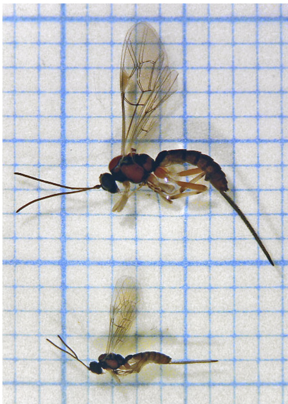
Abbildung 4: Die Schlupfwespe Scambus pomorum als Beispiel für einen natürlichen Feind eines wichtigen Phytophagen von Apfelbäumen (Apfelblütenstecher), der unterschiedliche Häufigkeit und Wachstum auf verschiedenen Sorten des Kulturapfels ( Malus domestica ) aufweist. Die Abbildung zeigt die Größenvariabilität weiblicher S. pomorum -Schlupfwespen.