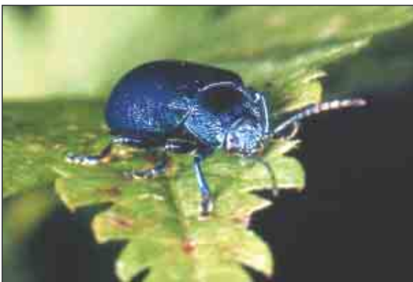
Abb. 1: Erzfarbener Erlenblattkäfer ( Melasoma aenea ); Foto: Roland Vopper

Mit 54 phytophagen Insektenarten besitzt die Schwarzerle im Vergleich mit anderen kurzlebigen Baumarten mit Pioniercharakter („Weichlaubhölzer“) deutlich weniger Arten als z.B. die Birke (164 Arten) oder die Weide (218 Arten), aber fasst so viel wie die Aspe (67 Arten) und mehr als die Vogelbeere (26 Arten) (SCHMIDT 1998). Neben dem forstlich besonders bedeutsamen Erlenwürger ( Cryptorhynchus lapathi ) treten an Erlen v.a. auch auffällige Blattkäferarten, der Erzfarbene Erlenblattkäfer ( Melasoma aenea ) und der Blaue Erlenblattkäfer ( Agelastica alni ) auf. Neben Gemeinsamkeiten, z.B. fressen beide an Erlenblättern, besitzen sie aber auch Unterschiede in der Morphologie und im Auftreten.