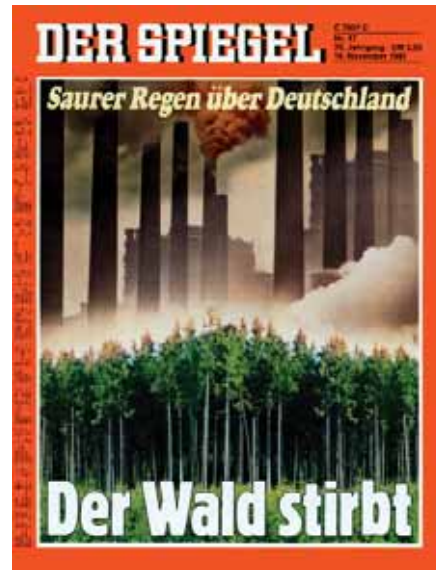
Abbildung 2: Der Spiegel 1981: Titelbild zum Waldsterben

Der Begriff des Tannensterbens war jedoch bereits sehr viel älter (Neger 1908). Erste Meldungen über ein „Tannensterben“ kamen zu Beginn des 19. Jahrhunderts aus Westböhmen. In den vergangenen 200 Jahren tauchte der Begriff dann immer wieder in der Literatur auf und wurde dabei uneinheitlich verwendet (Brandl 1985). Daraus resultierten ein scheinbar periodisches Auftreten der Krankheit (Krehan 1989) und wegen vermeintlich örtlicher Befallsunterschiede auch vielfältige Erklärungsversuche der Krankheitsursache (Schütt 1977; Seitschek 1981; Blaschke 1981, 1982; Larsen 1986). Schließlich wurde das Tannensterben als Komplexkrankheit, an der mehrere Schadfaktoren beteiligt sind, angesehen (Krehan 1989). Diese Einschätzung spiegelt sich in der Definition des Duden-Universalwörterbuches (2006) wider, nach der das Tannensterben ein „durch Verschmutzung der Luft und an Trieben und Nadeln saugende Schädlinge verursachtes, periodisch auftretendes Absterben von Weißtannen“ ist.