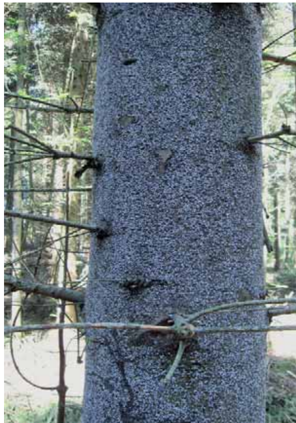
Abbildung 7: Starker Befall durch die Tannenstammlaus ( Dreyfusia piceae ) an einer circa 40-jährigen Tanne