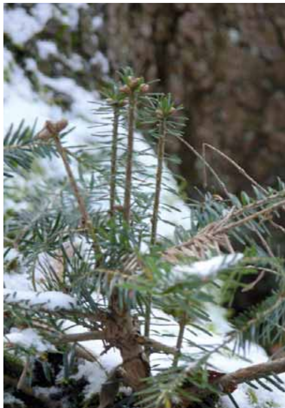
Abbildung 3: Ersatztrieb Bildung bei einer mehrfach verbissenen Weißtanne

Das Schalenwild bevorzugt die Tanne als Nahrungspflanze, z. B. gegenüber der Fichte, da sie über einen vergleichsweise hohen Nährstoffgehalt (insbesondere Stickstoff und Calcium) bei gleichzeitig geringen Gehalten die Verdauung behindernder, sekundärer Inhaltsstoffe (Lignin, Harz, u. a.) verfügt. Dieser bevorzugte Verbiss kann zu einer Entmischung der Verjüngung auf Kosten der Tanne bis hin zum vollständigen Ausfall der Baumart führen (Ruegg und Schwitter 2002). Senn et al. (2007) zeigten, dass die Verbissintensität an Pflanzen von 10 bis 130 Zentimetern Höhe signifikant mit der Populationsdichte des Schalenwildes ansteigt. Im Ergebnis führt dieses „Waldsterben von unten“ (SDW 2008) zu einer problematischen Gefährdung der Baumart, die sich insbesondere im Schutzwald katastrophal