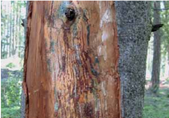
Abbildung 8: Gangsystem des Weißtannenrüsselkäfers ( Pissodes piceae )