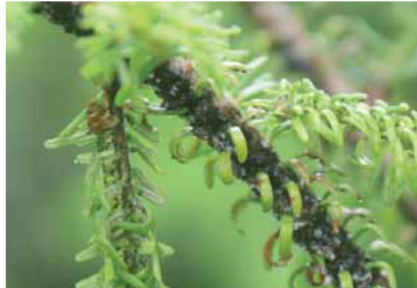
Abbildung 6: Charakteristisches Verkrümmen der Nadeln bei starkem Befall durch die Tannentrieblaus ( Dreyfusia nordmanniana )

Die Verlausung der Stämme durch die Tannenstammlaus oder die Tannentriebläuse führt zu starken Nährstoffverlusten und beeinflusst den Wasserhaushalt negativ, ist aber für den betroffenen Baum, insbesondere in höheren Altersklassen, in der Regel ungefährlich. Die Tannenstammlaus gilt daher nicht als bedeutendes Schadinsekt der Weißtanne (Schwerdtfeger 1981). Andererseits ist der Befall der Tannenstammlaus hinsichtlich einer möglichen Disposition für Sekundärbesiedler gleich zu bewerten mit dem Stammbefall der Tannentriebläuse. Die Stammverlausung ist ein Schüsselfaktor für die Entstehung der Tannen-Rindennekrose (Feemers et al. 2005).