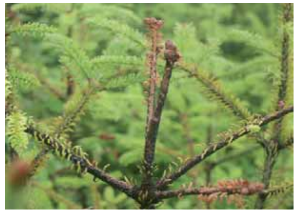
Abbildung 5: Abgestorbener Terminaltrieb nach Befall durch die Tannentrieblaus ( Dreyfusia nordmanniana )

cher Nebenzyklus auf der Weißtanne ab, die als neuer Sekundärwirt fungiert. Beide Dreyfusia -Arten bilden rinden- und nadelsaugende Formen aus, die sich als Phloemsauger aus den nährstofftransportierenden Leitungsbahnen ernähren.