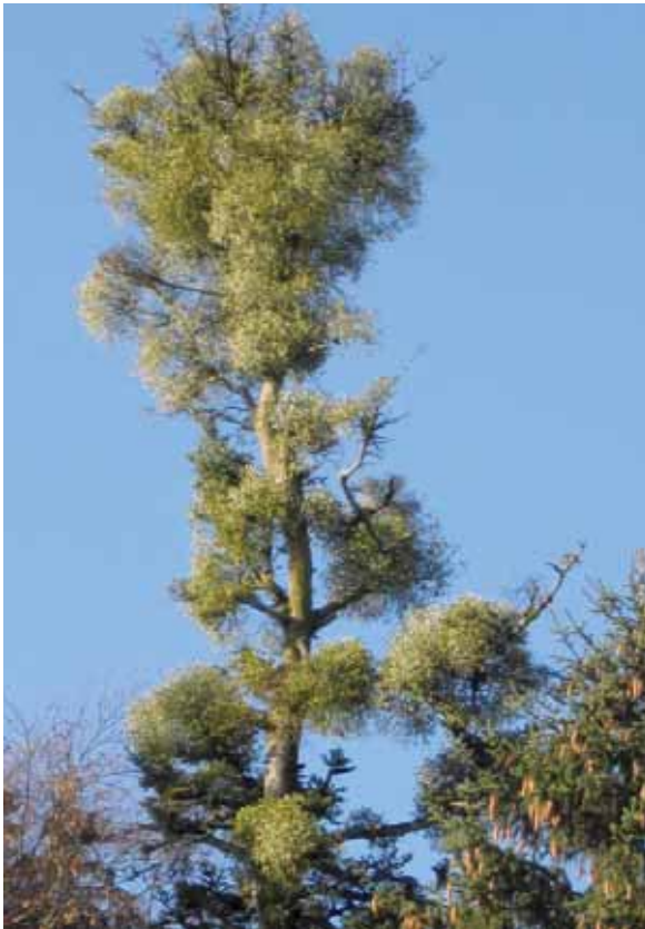
Abbildung 12: Massiver Mistelbefall

In den vergangenen Jahren wurde über ein verstärktes Auftreten der Tannen-Rindennekrose in Baden-Württemberg berichtet (Schröter et al. 2010). In Bayern tritt die Krankheit ebenfalls auf, ist aber auf einzelne Bestände beschränkt. Die Tannen-Rindennekrose entspricht in ihrem Krankheitsverlauf der Buchen-Rindennekrose und kann als Komplexkrankheit, an der mehrere Schadfaktoren beteiligt sind, verstanden werden.