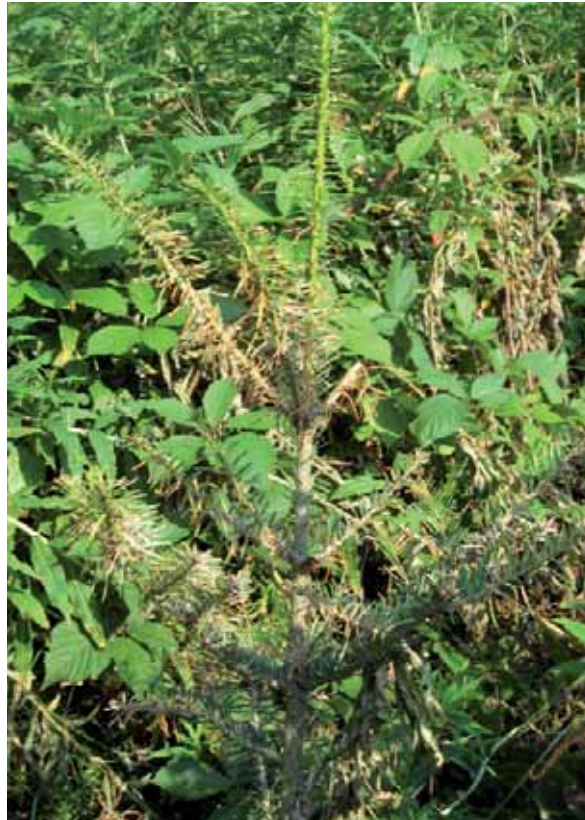
Abbildung 10: Starker Befall einer von Weidenröschchen umstandenen Tanne mit dem Tannen-Nadelrost

Die Grauschimmelfäule ( Botrytis cinerea ) ist eine weitverbreitete, wirtsunspecifische Art, die sowohl Laubbäume als auch Nadelbäume befallen kann. Überwiegend betroffen sind Douglasie, Tanne, Fichte und Lärche. Der Pilz befällt die Pflanzen in der Austriebsphase bei ausreichend hoher Luftfeuchtigkeit und eher niedrigen Temperaturen. Er bringt das junge, nicht verholzte Gewebe zum Absterben, die Maitriebe welken und hängen schlaff herab. Die Schäden können daher mit Spätfrostschäden verwechselt werden, allerdings tritt der Grauschimmel meist nur an einzelnen Trieben auf. Bei ausreichender Luftfeuchtigkeit entwickelt sich auf dem abgestorbenen Gewebe ein üppig wachsendes grau-braunes Luftmyzel. Die Schäden treten besonders in Saatbeeten, Kulturen und Dickungen auf und können zu erheblichen Ausfällen führen. Dichtstand fördert diese Schäden. Bei Altbäumen beschränkt sich der Schaden auf die Schattenkrone und ist nicht lebensbedrohlich (Butin 1996).