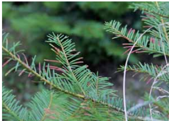
Abbildung 11: Kabatina-Nadelbräune der Tanne an Küstentanne ( Abies grandis )