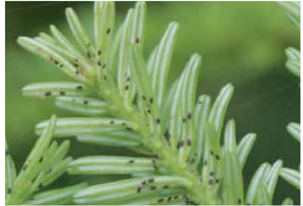
Abbildung 4: Nadelsauger der Tannentrieblaus ( Dreyfusia nordmanniana ) an Maitrieb

Die Tannentriebläuse der Gattung Dreyfusia wurden ab 1840 aus ihrem ursprünglichen Verbreitungsgebiet, der Kaukasusregion, mit Abies-nordmanniana -Pflanzen nach Mitteleuropa eingeschleppt. Zwei Arten werden unterschieden, die Einbrütige Tannentrieblaus ( Dreyfusia nordmanniana ) und die Zweibrütige Tannentrieblaus ( Dreyfusia merkeri ). Beide Arten durchlaufen im ursprünglichen Verbreitungsgebiet einen zweijährigen vollständigen Entwicklungszyklus, der aus mehreren Generationen besteht und einen Wirtspflanzenwechsel beinhaltet. Die geschlechtliche Fortpflanzung findet an der Orientfichte ( Picea orientalis ) als Primärwirt, die ungeschlechtliche Vermehrung an der Nordmannstanne ( Abies nordmanniana ) als Sekundärwirt statt. Dieser vollständige Zyklus wird in Mitteleuropa praktisch nicht beobachtet, da die Orientfichte in der Regel fehlt und die einheimische Fichte keinen adäquaten Ersatz darstellt. Vielmehr läuft ein einjähriger, ungeschlechtli-