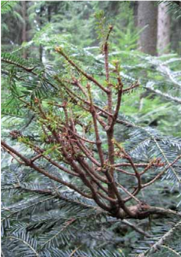
Abbildung 9: „Donnerbusch“, ausgelöst von Melampsorella caryophyllacearum , dem Erreger des Tannenkrebses – charakteristisch ist die einjährige, kurze und gelb verfärbte Benadelung.

Der Hexenbesen oder Donnerbusch (Abbildung 9) entsteht, wenn es dem Pilz gelingt, in eine Knospe einzudringen und sie über Pflanzenhormone zu einem abnormalen Wachstum anzuregen.