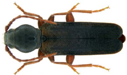
Abbildung 10: Imago des Lärchenbocks ( Tetropium gabrieli )

Befallene Bäume – meist Altbäume – erkennt man zu Beginn an Harz- und Bohrmehlaustritt sowie an trichterförmigen Spechtabschlägen. Später deutet eine schütterere Benadelung auf einen fortgeschrittenen Befall hin. Das erwähnte Ausharzen ist ein Abwehrmechanismus der Lärche, der durch das Einbohren der Larven angeregt wird. Vitale Bäume sind so in der Lage, den Befall erfolgreich abzuwehren.