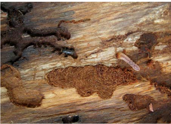
Abbildung 9: Der Große Lärchenborkenkäfer und der Lärchenbock können gleichzeitig in dickborkigen Lärchenstämmen brüten.

Oftmals ist in den dickborkigen Teilen des Stammes neben dem Borkenkäfer gleichzeitig auch der Lärchenbock ( Tetropium gabrieli Weise) zu finden (Abbildung 9). Durch den intensiven Larvenfraß dieser Käferart können gerade geschwächte Lärchen frühzeitig absterben.