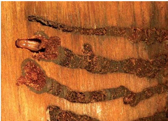
Abbildung 6: Jungkäfer des Lärchenborkenkäfers beginnt mit dem sekundären Reifungsfraß am Brutort.

Die Jungkäfer vollziehen ihren Reifungsfraß am Brutort neben den Puppenwiegen. Sie legen bei diesem sekundären Reifungsfraß Plätze oder unregelmäßig verlaufende Gänge an, welche den Splint schwach furchen (Abbildung 6). Das ursprüngliche Brutbild kann dabei völlig zermulmt werden. Bei hoher Besiedlungsdichte und zu schnellem Austrocknen des Brutraumes suchen die Jungkäfer zum Reifungsfraß wie auch Altkäfer zum