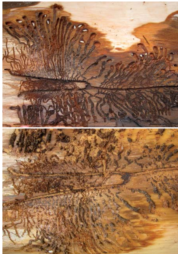
Abbildung 5: Das typische Brutbild des Lärchenborkenkäfers mit 3 Muttergängen, Larvenfraß und Puppenwiegen ist in dünnborkigen Stammereichen sowohl in der Rinde (oben) als auch im Splint (unten) zu sehen.

Der Lärchenborkenkäfer ist ein polygamer Rindenbrüter. Von der Rammelkammer ausgehend verlaufen meist 3 bis zu 20 cm lange Muttergänge erst quer dann längs zur Stammachse. Nach der Anlage der ersten Generation führen die geschwächten Weibchen einen Regenerationsfraß im Brutbild durch. Diese „sterilen“ Gänge ohne Einischen, sogenannte Witwengänge, sind