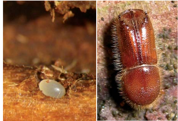
Abbildung 7: Seitlich vom Muttergang abgelegtes Ei in einer Einische (links); Der Lärchenborkenkäfer entwickelt sich in etwa neun Wochen vom Ei zum Jungkäfer (rechts).

Regenerationsfraß die Triebe und Zweige vitaler Lärchen auf (Schremmer 1955). Dieser primäre Reifungsfraß an Trieben wurde erstmals 1925 von Prell beschrieben und tritt innerhalb der Unterfamilie Ipinae nur bei dem Großen Lärchenborkenkäfer auf. Die Triebe werden bis zum Splint befallen oder ähnlich dem Reifungsfraß der Waldgärtner-Arten tunnelartig ausgehöhlt. Die beschädigten Äste werden vom Wind leichter gebrochen und die so geschwächten Lärchen sind im Folgejahr anfälliger für den Brutfraß (Nierhaus-Wunderwald 1995). Je nach Höhenlage und Witterungsbedingungen kann der zu den Spätschwärmern zählende Borkenkäfer ein bis zwei Generationen sowie Geschwisterbruten im Jahr mit den Hauptflugzeiten Ende April/Anfang Mai und Ende Juli/Anfang August entwickeln (Schwenke 1974). Von der Eiablage bis zum Schwärmflug der Jungkäfer vergehen im Durchschnitt neun Wochen (Abbildung 7). Alle Entwicklungsstadien überwintern in der Regel im Brutbild, fertige flugbereite Käfer gehen auch in die Bodentreu.