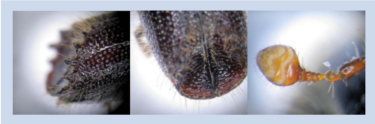
Abbildung 4: Morphologische Merkmale des Lärchenborkenkäfers; links: typische Absturzbezahnung, Mitte: lackglänzende Absturzfläche mit behaarter Flügeldeckennaht in der oberen Hälfte, rechts: Fühlerkeule mit stark bogigen Quernähten. (Fotos: M. Weber, LWF)

Trat der Schädling Ende des 19. Jahrhunderts noch mehrheitlich als Besiedler der Zirbelkiefer ( Pinus cembra ) und der Europäischen Lärche ( Larix decidua ) in Hochtälern der Alpen in Erscheinung, so befällt er heute die Zirbelkiefer nur noch selten. Derzeit gilt die Lärche in Mitteleuropa als Hauptwirt (Wenk 2010). Als eher seltene Brutbaumarten werden in der Literatur die Gemeine Kiefer ( Pinus silvestris ), Bergkiefer ( Pinus montana ), Gemeine Fichte ( Picea abies ), Weißtanne ( Abies alba ) und Japanische Lärche ( Larix kaempferi ) aufgeführt (Schwenke 1974, Nierhaus-Wunderwald 1995). Freude et al. (1981) nennt zudem die Douglasie ( Pseudotsuga douglasii ) als mögliche Wirtsart und Pfeffer (1995) die Dahurische sowie Sibirische Lärche.