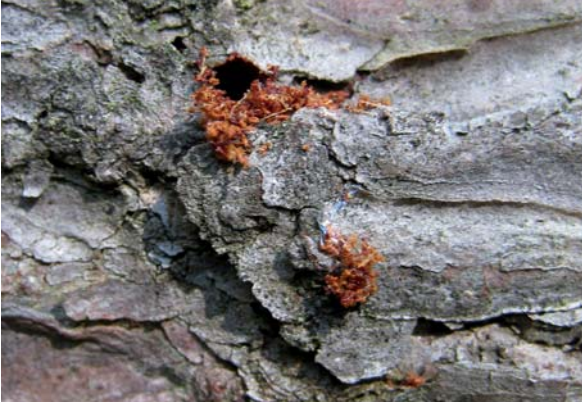
Abbildung 8: Einbohrloch des Lärchenborkenkäfers mit Bohrmehlauswurf.