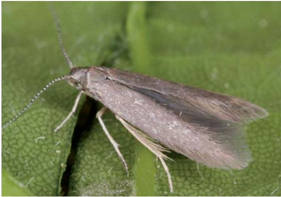
Abbildung 1: Lärchenminiermotte mit den markanten fransenbesetzten Flügeln.