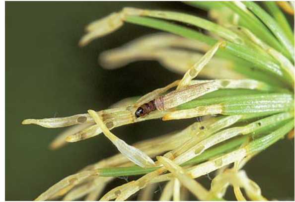
Abbildung 2: Minierende Raupe der Lärchenminiermotte an Lärchennadeln.

gel sind eher dunkelgrau gefärbt, schmal lanzettlich und mit längeren Fransen versehen, als die Vorderflügel (Abbildung 1).