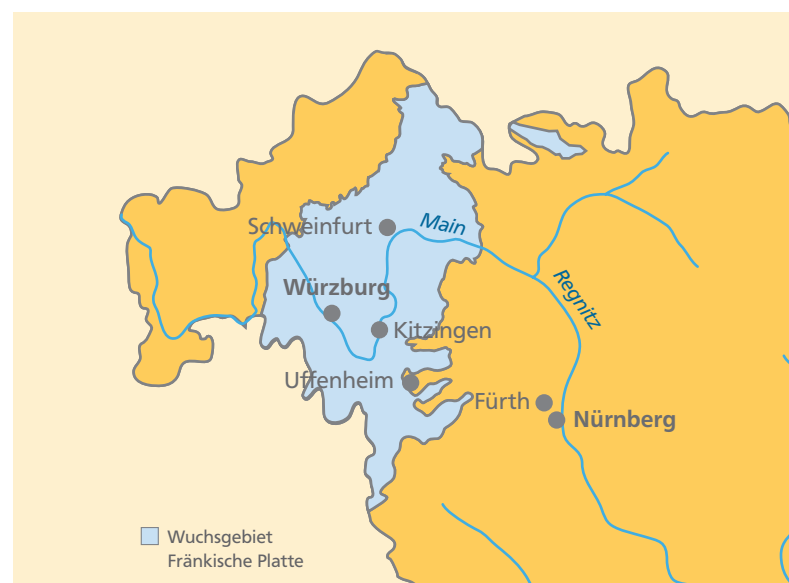
Abbildung 1: Der Schwerpunkt des akuten Eichensterbens befindet sich im Wuchsgebiet Fränkische Platte.

Ab dem Jahr 2010 wurde dann ein einzelbaumweises bis gruppenweises Absterben großkroniger, optisch vitaler Eichen beobachtet. Die Eichen trieben zu Beginn der Vegetationsperiode gar nicht oder sehr langsam und zeitverzögert aus, was auf die bestehende Vitalitätsschwächung hindeutete. Im Rahmen der Überwachung der Eichenschadinsekten war es daher notwendig, 3.000 Hektar Waldflächen besonders geschädigter