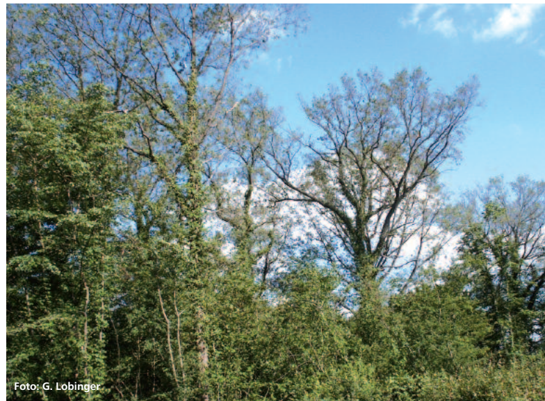
Abbildung 1: Starker Fraß der Raupen des Eichenprozessionsspinners

Neben den bekannten Kerngebieten erstreckte sich das Befallsgebiet beinahe auf die gesamte Fläche Mittel- und Unterfrankens. Leichter bis deutlicher Fraß trat in Oberfranken im Raum Bamberg sowie im Donau-Auwald in Schwaben auf, ein kleinräumiges Vorkommen wurde aus Neumarkt in der Oberpfalz gemeldet.