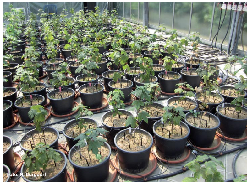
Abbildung 4: Mit Verticillium dahliae infizierte und nicht infizierte Bergahorne mit installierter Bewässerungsanlage in der Vegetationshalle am Gewächshauslaborzentrum Dürnast der TU München

die auf Verticillium dahliae zurückzuführen waren (Siemonsmeier et al. 2012). Nach Untersuchungen von Schneidewind (2006) an Berghorn-Alleebäumen entstanden die durch Verticillium verursachten Stammrisse zu 80 % während heißer und trockener Wetterperioden von Mai bis September. Die entstandenen Risse überwallen häufig mit den Jahren wieder. Allerdings sind die offenen Holzkörper Eintrittspforten für holzzeretzende Pilze, die als Sekundärerreger das bereits befallene Gewebe besiedeln können.