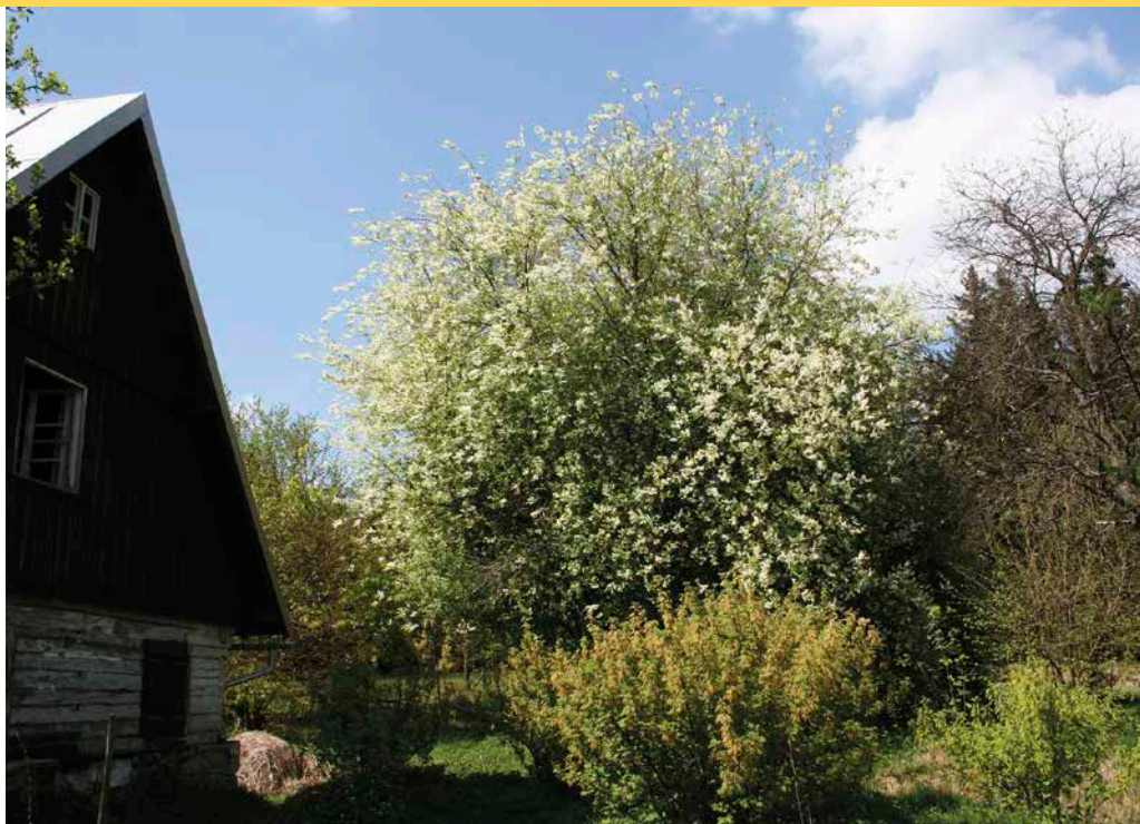
5 Mit Höhen bis zu 18 m können Traubenkirschen zu durchaus stattlichen Bäumen heranwachsen und bilden damit bedeutende Lebensräume für Insekten und Vögel.

Eine besondere tierökologische Bedeutung weist die Traubenkirsche durch das Vorkommen der Traubenkirschen-Hafer-Blattlaus ( Rhopalosiphum padi ) auf. Die früh austreibende und früh blühende Traubenkirsche bietet bereits im April ein reiches Insektenangebot, das insbesondere von vielen Singvögeln als Nahrung genutzt wird. Eine besondere Rolle spielt hierbei die Traubenkirschen-Hafer-Blattlaus. Diese Laus überwintert als Ei auf der Traubenkirsche. Im Frühjahr entsteht eine erste, ungeflügelte Generation, später folgen auch geflügelte Weibchen. Diese wandern im Mai/Juni auf Gräser (Hafer!) ab, von wo ab Ende August bis Mitte September die beflügelten Weibchen und Männchen wieder auf die Traubenkirsche zurückkehren (Glutz von Blotzheim 2010).