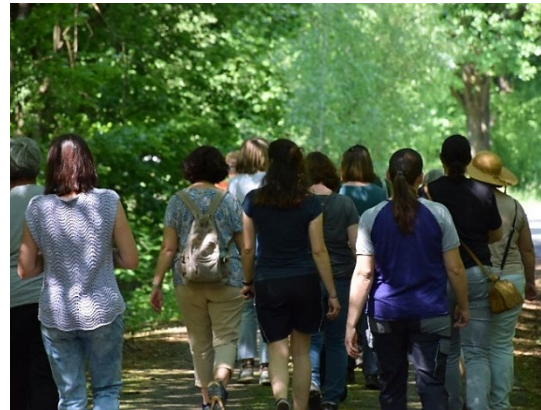
Waldbesitzerinnen im Landkreis Kelheim

Der Informationstag für Waldbesitzerinnen findet auf Initiative des LWF Projekts „Fem4Forest – Wald in Frauenhänden“ statt und wird zusammen mit der WBV Rosenheim, der WBV Wasserburg und der Waldbauernschule Kelheim veranstaltet.