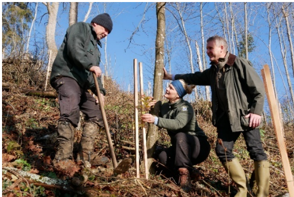
Waldbesitzer, ÄELF Försterin und WBV Vertreter

Mehr Infos für Waldbesitzende, einschließlich des Försterfinders , gibt es im Internet: https://www.waldbesitzerportal.bayern.de