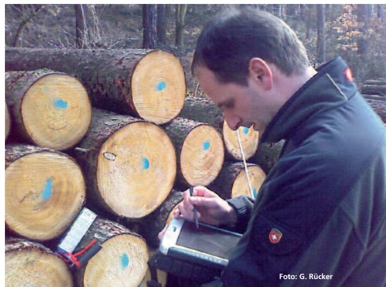
Abbildung 1: Bis zu 80.000 Festmeter Holz werden zukünftig mittels WaldInfoPlan in der FBG Aitrach-Isar-Vils jährlich im Wald aufgenommen.

Der VfS entwickelte in Zusammenarbeit mit der Forstbetriebsgemeinschaft Aitrach-Isar-Vils und unter Einbindung der Firma DekaData ein Holzmanagement-Modul. Die FBG Aitrach-Isar-Vils w.V. ist ein innovativer forstlicher Zusammenschluss in Niederbayern. Circa 85 Prozent der Holzmenge – jährlich bis zu 80.000 Festmeter – vermarktet die FBG eigenständig. WaldInfoPlan unterstützt die FBG bei der Holzaufnahme mit robusten Feld-PCs im Wald. Anschließend wird im Büro dis-