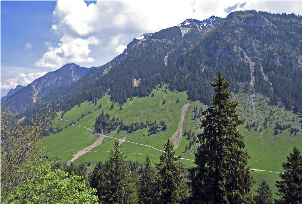
Abbildung 2: Flachgründige Rutschungen beginnen häufig erst außerhalb des Waldes.