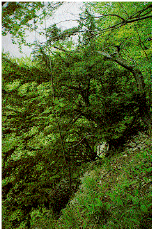
Abb. 4: Alteibe am Steilhang

Weitere Beobachtungen sollen hier noch mitgeteilt werden, die unter Umständen bereits für das Ausbleiben von Verjüngung verantwortlich waren. Im Herbst konnte zuweilen ein "Beschneiden" samentragender Zweige an den Alteiben festgestellt werden. Die Nüßchen waren durchweg deckelähnlich aufgeschnitten oder gehackt und die Samen herausgepickt. Meines Erachtens kommen hierfür Vogelschwärme (Finken oder Kreuzschnäbel) oder Mäuse in Frage, da dies innerhalb weniger Tage geschah und wahrscheinlich alle weiblichen Bäume betroffen waren. Im Herbst oder auch erst bei Schnee wurden die am Boden liegenden Zweige offenbar gern durch das Rehwild aufgenommen, wie die Fährten bewiesen. Noch am Baum verbliebene Samen erwiesen sich meist als taube Hohlkörner, ein Umstand, der weitere Beachtung verdient.