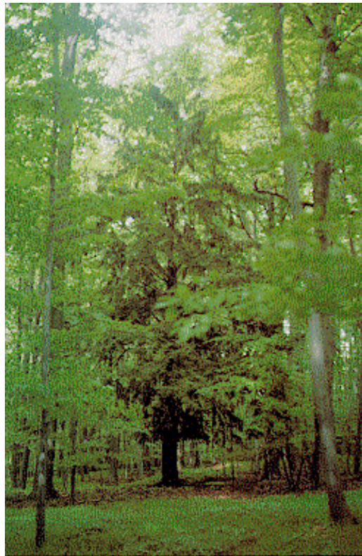
Abb. 3: Stärkste Eibe im Naturschutzgebiet Veronikaberg

Die Vorkommen zwischen Arnstadt und Ilmenau bestehen im wesentlichen aus zwei größeren Beständen am Singener Berg bei Stadtilm und am Veronikaberg bei Martinroda. Seit 1932, wegen Eibe und Tanne unter Schutz gestellt, ist der Veronikaberg (Frohnberg) eines der ältesten Naturschutzgebiete in Thüringen (Abb. 3). An einem Nordwest-Hang wachsen auf rund 100 ha 750 Alteiben. Sie bilden auch hier die zweite Baumschicht in Buchenmischbeständen und Reinbeständen unterschiedlichen Alters. Bei allen Laubwald-Vorbeständen handelt es sich um ehemalige Nieder- und Mittelwälder, die in Buchen-Hochwald überführt wurden. Bei älteren Bestandesteilen ist der frühere Mittelwaldcharakter noch zu erkennen. Im Habitus ähneln die meisten Eiben der Fichte, ihre Kronen sind spitz, aufstrebend und nur selten weitausladend. Fast 2/3 der Bäume weisen einen Brusthöhendurchmesser von 15 bis 25 cm auf. Nur einige erreichen einen Durchmesser um 50 cm. Die stärkste Eibe wurde mit 53 cm Brusthöhendurchmesser und einer Höhe von 17 m ermittelt. Sie wird von einer etwas schlankeren in der Höhe noch um einen Meter übertroffen. Eine 20 m hohe Eibe ist vor einigen Jahren abgestorben. Die überwiegenden Höhen liegen aber zwischen 9,0 m und 14,5 m. Eine jüngere Eibengeneration fehlt, ebenso wie in den anderen Gebieten, hier vollkommen.