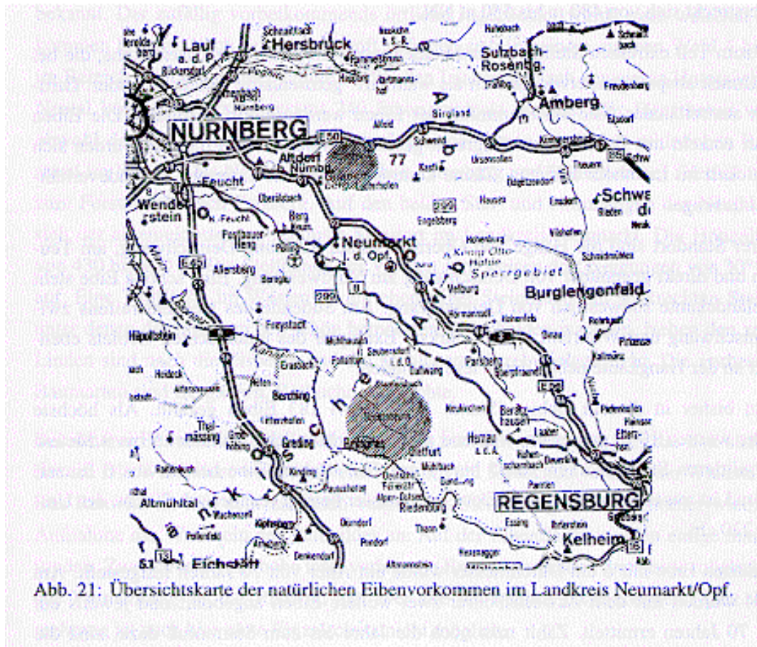
Abb. 21: Übersichtskarte der natürlichen Eibenvorkommen im Landkreis Neumarkt/Oberpfalz