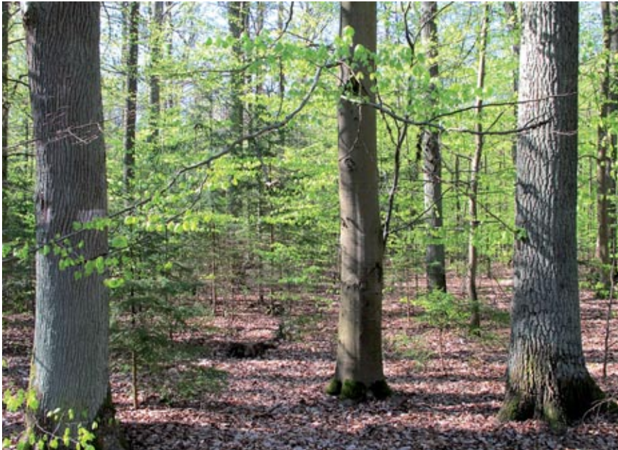
Abbildung 2: Trauben- (links) und Stieleiche (rechts)