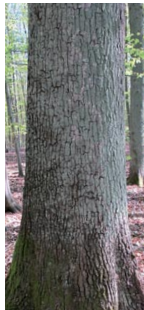
Abbildung 3: Traubeneiche

Der Aufbau der Traubeneichenkrone ähnelt mehr der Buche, die Äste sind dünner und gehen in gleichmäßigerer Verteilung spitzwinkliger vom Stamm aus. Ihre Blätter sind an den Zweigen gleichmäßig verteilt und nicht büschelig angeordnet. Im Vergleich mit typischen Traubeneichen sind die Verzweigungen der