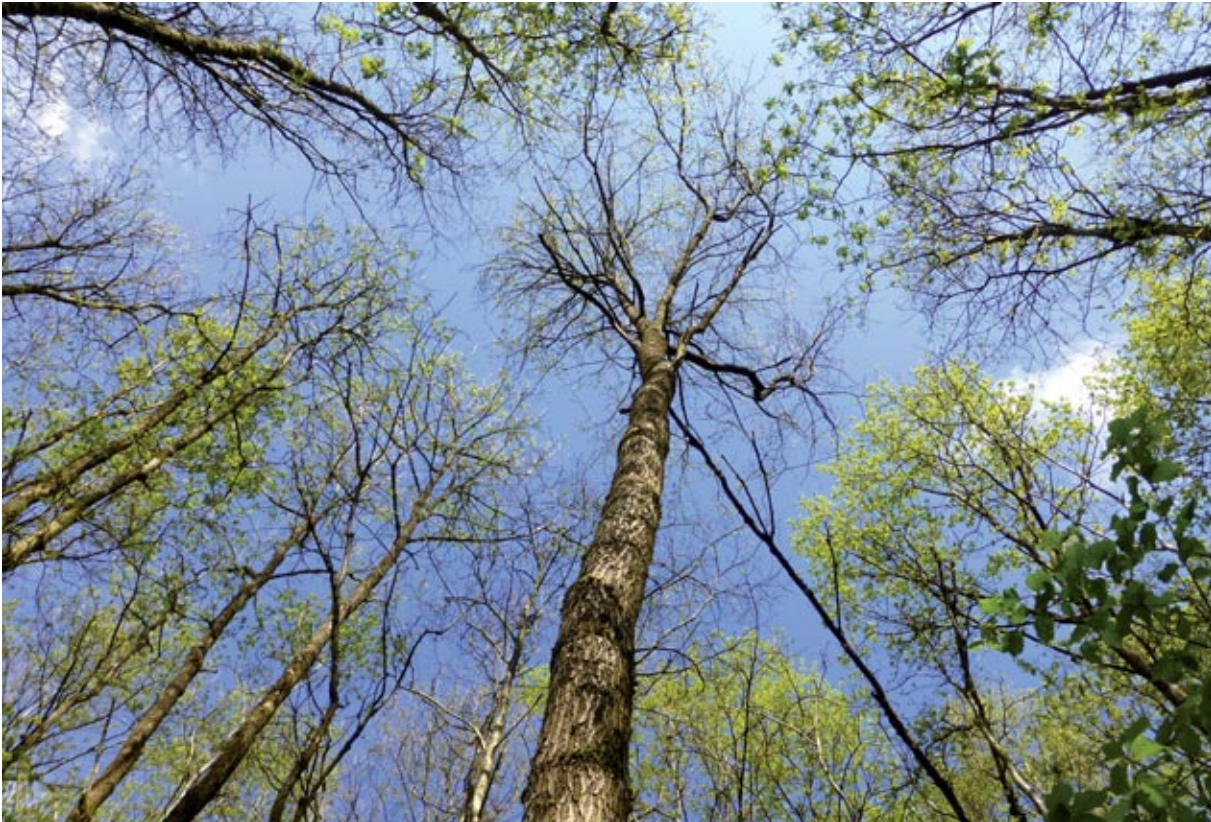
Abbildung 6: Eichenpflege

In der Literatur werden die Versuche mit den Eichenestern immer wieder als nicht zielführend dargestellt. Beim genauen Lesen bzw. Überprüfen der Flächen vor Ort ist festzustellen, dass die Misserfolge nicht so sehr mit dem Verfahren an sich, sondern viel mehr mit überhöhten Rehwildbeständen zu tun hatten. Mit dem Verfahren der Eichennesterpflanzung spart man sowohl Kultur- und vor allem Pflegekosten. Die Baumarten, die sich dazu noch über die natürliche Sukzession einstellen, bereichern die Wälder und können waldbaulich genutzt werden.