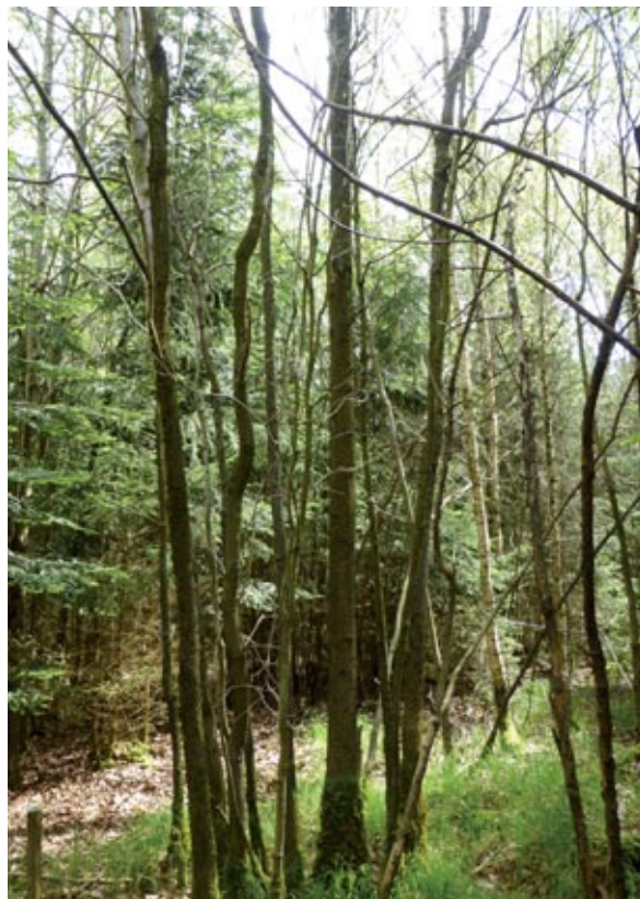
Abbildung 5: Eichennester