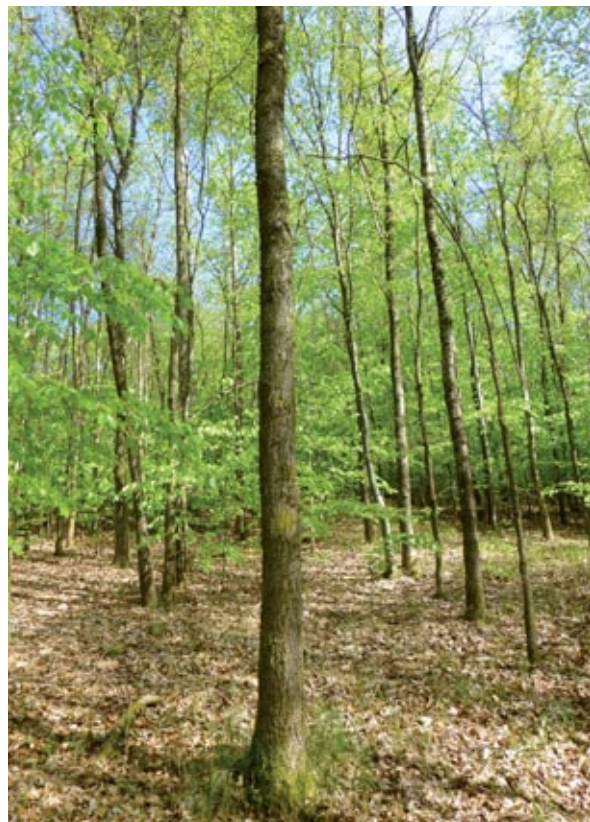
Abbildung 7: Eichenpflege

In der Literatur werden die Versuche mit den Eichenestern immer wieder als nicht zielführend dargestellt. Beim genauen Lesen bzw. Überprüfen der Flächen vor Ort ist festzustellen, dass die Misserfolge nicht so sehr mit dem Verfahren an sich, sondern viel mehr mit überhöhten Rehwildbeständen zu tun hatten. Mit dem Verfahren der Eichennesterpflanzung spart man sowohl Kultur- und vor allem Pflegekosten. Die Baumarten, die sich dazu noch über die natürliche Sukzession einstellen, bereichern die Wälder und können waldbaulich genutzt werden.