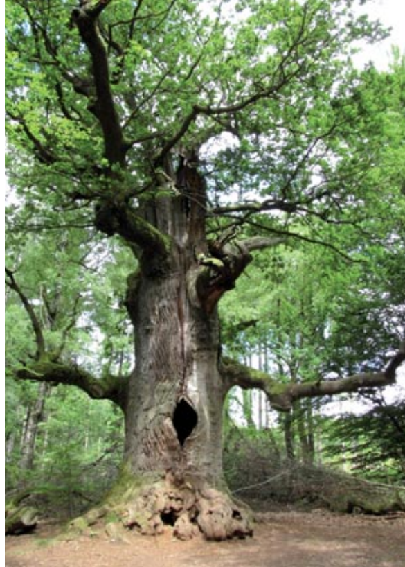
Abbildung 1: Die Gerichtseiche ist die wohl älteste Eiche im hessischen Reinhardswald.

Fast immer wird der Wert eines Baumes aufgrund seines Nutzens für den Menschen definiert, sei er historisch, religiös, mythologisch, medizinisch, wirtschaftlich oder wissenschaftlich. Selbst einen Baum nur schön oder unter ihm die ersehnte Ruhe zu finden, setzt eine ästhetische oder spirituelle Erwartung voraus. Besonders wenn wir über die Ansammlung von Bäumen in Wäldern oder Beständen schreiben, steht für uns Förster der wirtschaftliche Nutzen im Vordergrund.