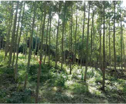
Pappeln im Populetum Freising (Herbst 2019)

Bis vor wenigen Jahren wurden leistungsfähige Hybridpappelsorten verstärkt in Form von Kurzumtriebsplantagen (KUP) auf weniger produktiven Acker- und Grünlandflächen angebaut. Ziel war die Versorgung von Heizkraftwerken mit Hackschnitzeln. Durch hohe Investitionen in Züchtung und Prüfung konnte die Palette geeigneter Pappelhybridsorten deutlich ausgeweitet werden. Derzeit stehen der Praxis etwa 15 empfohlene Sorten zur Verfügung.