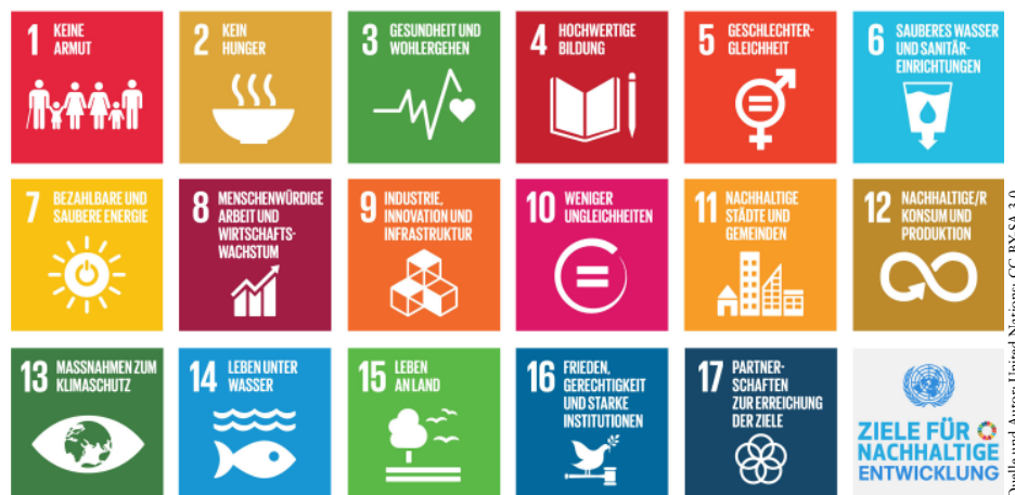
Abb. 1: Übersicht der 17 Ziele für Nachhaltige Entwicklung („SDGs“ = Sustainable Development Goals) im Weltaktionsprogramm (WAP) zur BNE der Vereinten Nationen