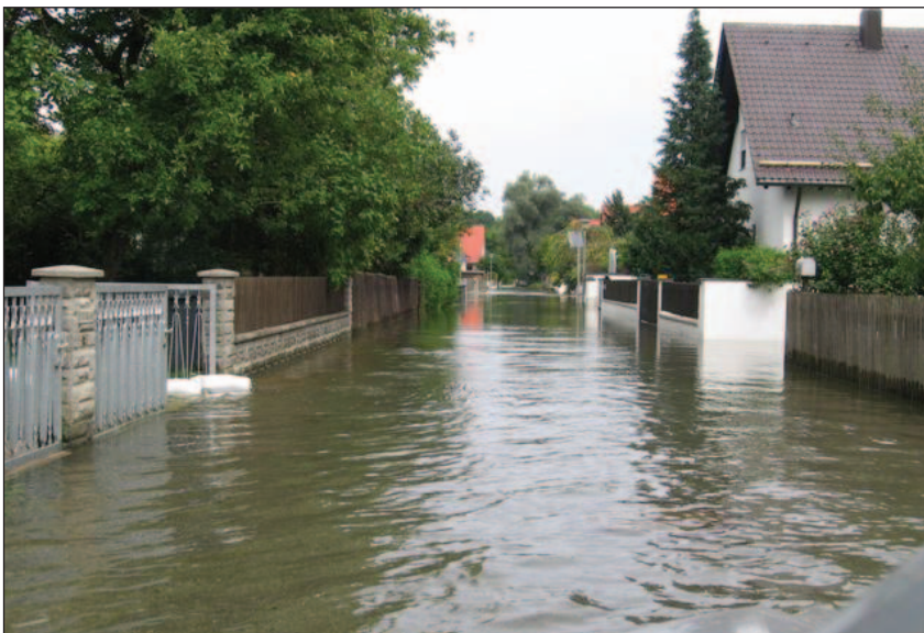
Abb. 3: Die Isarstraße wurde von austretendem Grundwasser überschwemmt.