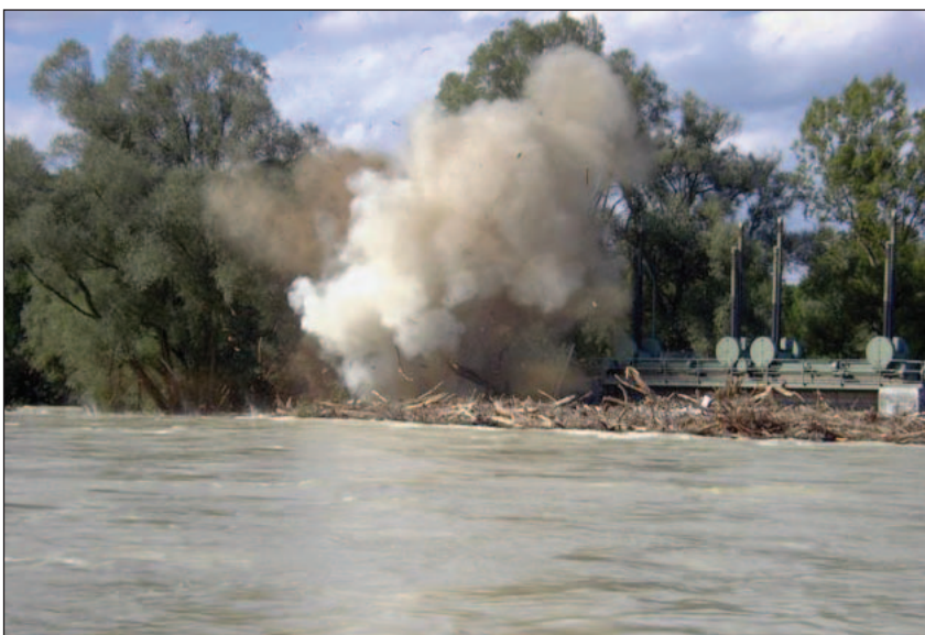
Abb. 4: Treibgut hat sich an der Schleuse gestaut und musste gesprengt werden.