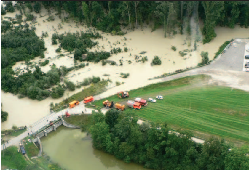
Abb. 2: Im August 2005 hat der Damm an der Isar noch gehalten.