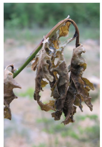
In der Frostnacht des 4. Mai 2011 auf einer Kahlfläche erfrorene Frühjahrsaustriebe an Fichte, Buche, Tanne und Eiche (v. l. n. r.).