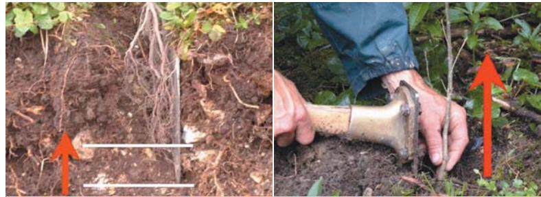
links: Pflanzloch: Wurzellänge und Raum zum Hochziehen. rechts: Pflanze vor Schließstich anziehen.