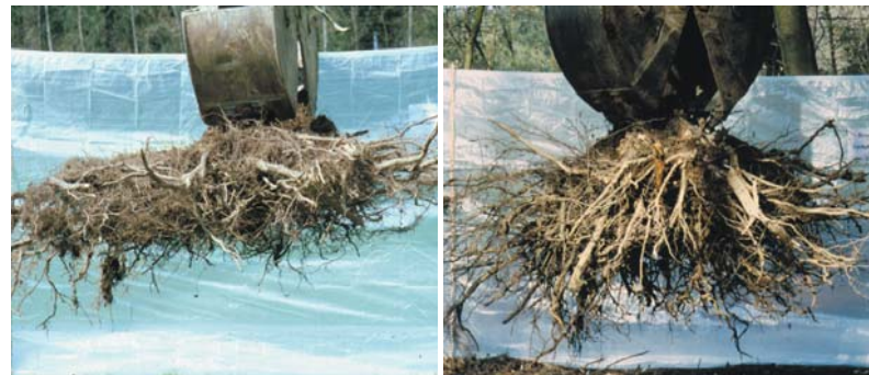
links: 35-jähriger Bergahorn aus Winkelpflanzung: Sehr flachstreichendes Wurzelwerk. rechts: 37-jähriger Bergahorn aus Lochhügelpflanzung: Kräftige Herzwurzeln, die weit in die Tiefe reichen.