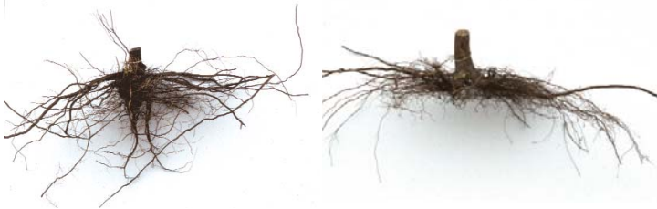
links: 10-jähriger Bergahorn: Fachgerecht gepflanzt rechts: 10-jähriger Bergahorn: Unsachgemäß gepflanzt

Das beste Pflanzverfahren ist nur so gut wie seine Anwendung. Bereits kleine Pflanzfehler können die Wurzelentwicklung stark beeinträchtigen.