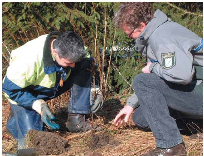
Revierleiter kontrolliert mit dem Pflanzler die Pflanzenqualität

Die Kontrolle auf festen Sitz der Pflanze oder das Anwuchsprozent allein reichen für die Beurteilung der Pflanzqualität nicht aus.