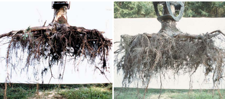
links: 35-jährige Fichte aus Winkelpflanzung: Flaches Wurzelwerk, geringe Wurzelentwicklung in die Tiefe. rechts: 35-jährige Fichte aus Naturverjüngung: Zahlreiche und starke Wurzeln wachsen in die Tiefe.

→ Selbst nach mehreren Jahrzehnten lassen sich Unterschiede zwischen Naturverjüngung und Pflanzung sowie zwischen verschiedenen Pflanzverfahren feststellen.