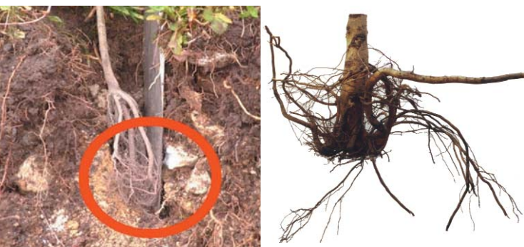
links: Stauchung beim Pflanzen: Die Wurzeln werden umgebogen. rechts: Stauchung nach 10 Jahren: Die Wurzeln wachsen nicht mehr in die Tiefe.