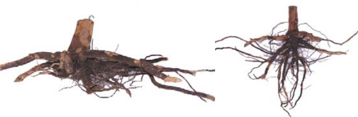
Zehnjähriger Bergahorn: links: Winkelpflanzung mit sehr flachem, einseitigen Wurzelwerk. rechts: Naturverjüngung mit sehr guten Tiefenwurzeln.

Natürlich verjüngte/gesäte Bäume haben im Vergleich zu gepflanzten Bäumen weniger und schwächere Wurzeldeformationen. Aus diesem Grund lassen sich Deformationen besonders effektiv und kostengünstig durch Naturverjüngung oder Saat vermeiden.