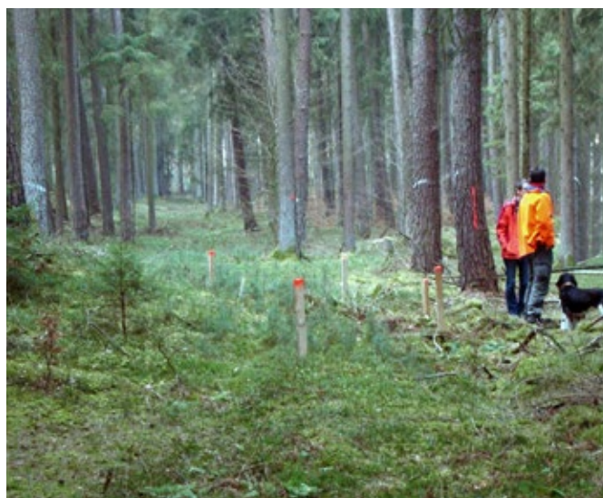
Verpflockter Grabhügel am Rand einer Rückegasse