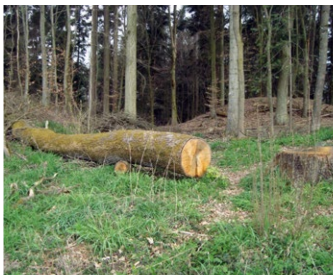
Eine ursprünglich zwischen zwei Grabhügeln hindurch angelegte Rückegasse wurde mit Hilfe eines Baumstamms gesperrt.