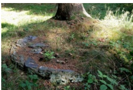
Reste eines Pechofens