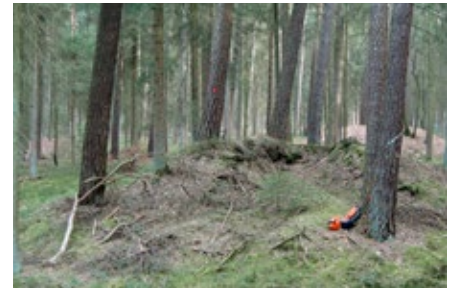
Aufgegrabener und zerstörter Grabhügel

Erholungssuchende die spezifischen Strukturen nicht oder sind sich der Bedeutung der Objekte nicht bewusst. Gelegentlich werden Kulturgüter auch durch Vandalismus oder Raubgrabungen geschädigt.