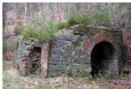
Reste eines Kalkofens bei Greding