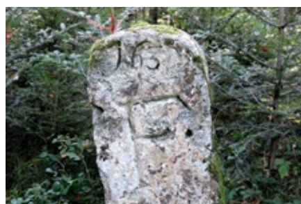
Grenzstein aus dem Jahr 1639