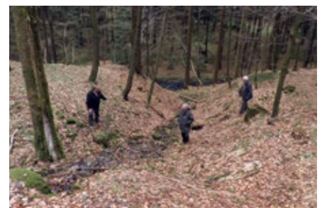
Stämme gelangen via Lassen in den Bach