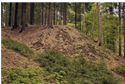
Halde eines Wetzsteinbruches

Die Broschüre »In Boden und Stein« können Sie auf www.lwf.bayern.de unter Publikationen kostenlos bestellen. Die Wanderausstellung »DenkMal im Wald« können Sie auf www.forstzentrum.de kostenlos anfordern. Dort finden Sie auch eine Terminliste mit den nächsten Standorten der Ausstellung.