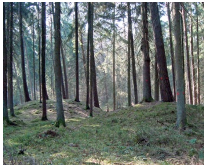
Die beiden Grabhügel sind hier leicht zu erkennen.