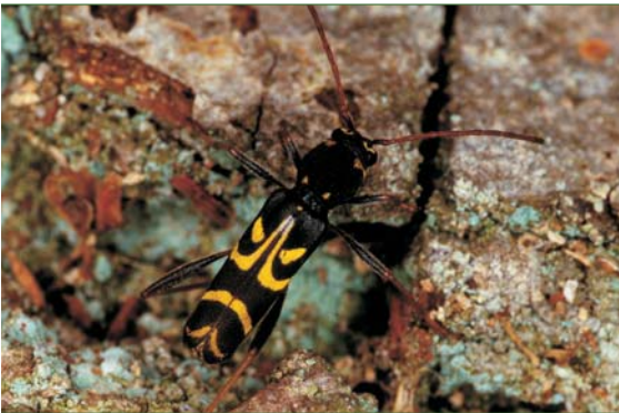
Der Wendeckreis-Widderbock liebt sonniges Kronentotholz.

In Mulmhöhlen mit Erdkontakt findet man Urwaldreliktarten wie den Veilchenblauen Wurzelhalsschnellkäfer. Es sind hochgradig gefährdete Arten mit speziellen Habitatansprüchen und langen Entwicklungszeiten. Eine besondere Nische stellen auch mit Wasser gefüllte Baumhöhlen dar, die z.B. sogar Molche zur erfolgreichen Vermehrung nutzen können.