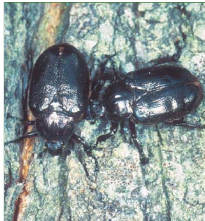
Der Eremit ist ein sehr seltener Käfer, der an alte, vermodernde Eichen gebunden ist.