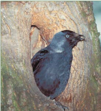
Dohlen brüten in den Höhlen alter Bäume.

bis zur Krone und nutzen ihn als Lebensraum. In „aufgeräumten“ Wäldern, ohne Biotopbäume, fehlen auch diese Spezialisten. So bildet z.B. das Kronentotholz für viele wärmeliebende Arten aus der Familie der Bock- und Prachtkäfer ein wichtiges, da warmes und relativ trockenes Habitat.