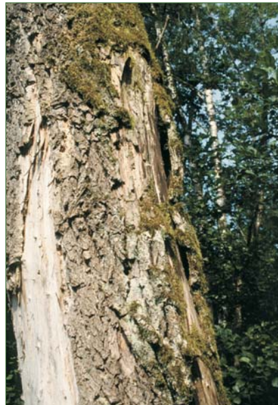
Der marmorierte Rosenkäfer benötigt Mulmhöhlen.