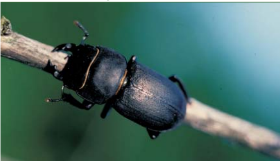
Der Balkenschötter, ein kleiner Bruder des Hirschkäfers, benötigt morsches Totholz von Laubbäumen.