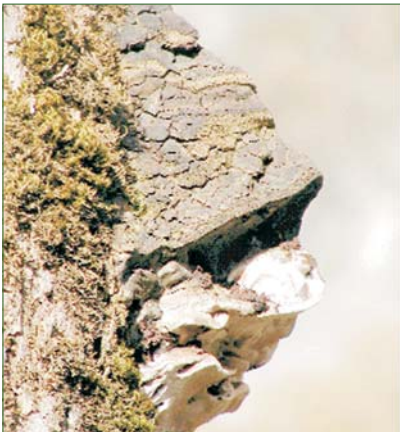
Ein Feuerschwamm bildet mehrjährige, besonders harte Fruchtkörper.