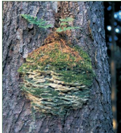
Die Hornisse baut ihr Nest auch in Baumhöhlen.