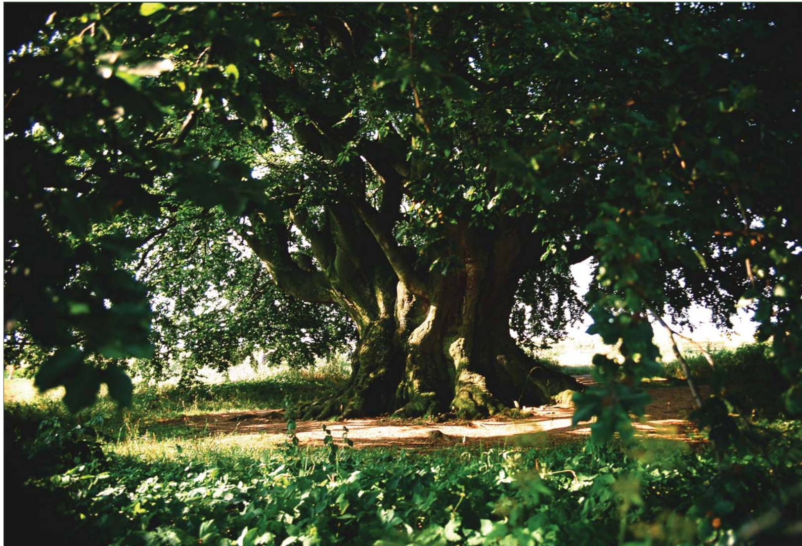
Die Bavariabuche bei Pondorf/Eichstätt