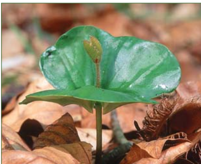
Alle Bäume fangen klein an: das Bild zeigt einen Buchenkeimling

Alte Bäume lehren uns nach Wachsen und Werden zu riesiger Größe auch das Vergehen; sie sind trotz ihrer Größe und Stärke vergänglich wie alles auf der Welt.