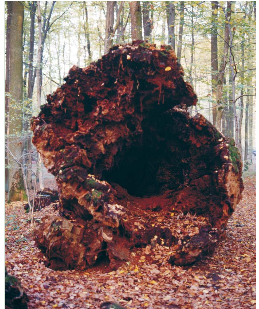
Mächtiger Torso der Wendelins-eiche bei Geisfeld/Oberfranken im Jahr 2002