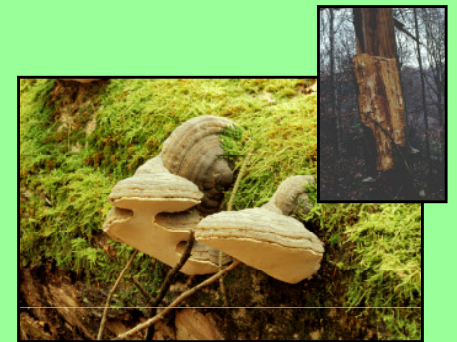
Zunderschwamm Fomes fomentarius