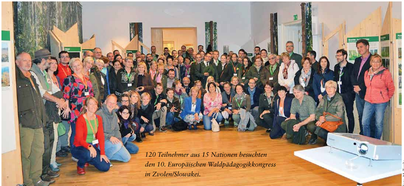
120 Teilnehmer aus 15 Nationen besuchten den 10. Europäischen Waldpädagogikkongress in Zvolen/Slowakei.

140 Teilnehmer aus 15 Staaten diskutierten darüber, wie die zukünftigen Herausforderungen, vor denen die Waldpädagogik steht, gemeistert werden und wie Waldpädagogen die höheren Stufen einer Bildung für Nachhaltige Entwicklung (BNE) erklimmen können.