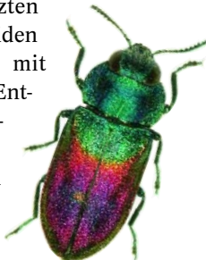
Abbildung 1: Anthaxia salicis

Die Larven der meisten eichenbewohnenden Prachtkäfer fressen in den nährstoffreichen Schichten der Kambialzone, der inneren Rindenschichten und der oberflächennahen Holzschichten flache Gänge. Die Fraßbilder sind sehr charakteristisch, verlaufen fast immer zickzackförmig und sind mit fest gepresstem Bohrmehl verstopft. Die Ausbohrlöcher sind flach oval, wobei der obere Bogen etwas höher gewölbt ist als die »Bauchseite«. Die Larven benötigen wie die adulten Tiere trocken-warme Bedingungen, die sie in aufgelockerten Beständen oder im lichten, aber windgeschützten Kronenraum der Bäume finden. Sie meiden grundsätzlich kühle Waldinnenräume mit relativ hoher Luftfeuchtigkeit, die ihre Entwicklung hemmen. Viele Forschungsarbeiten zeigten, dass gut wasserversorgte Bäume die sich einbohrenden Larven meist abwehren können.