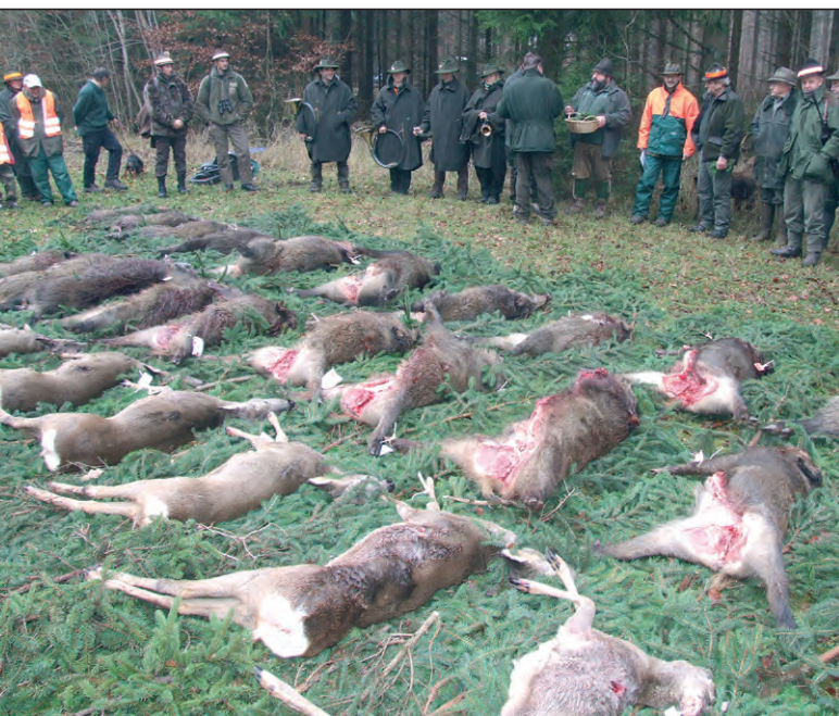
Abb. 1: Seit nunmehr sieben Jahren werden in Bayern jährlich über 40.000 Stück Schwarzwild erlegt. Haben die Empfehlungen zur Reduktion der Schwarzwildbestände nicht gegriffen?

Als einen ersten Schritt wurden Sprecher der drei involvierten Verbände anhand eines standardisierten Gesprächsleitfadens befragt. Die Gespräche dauerten durchschnittlich