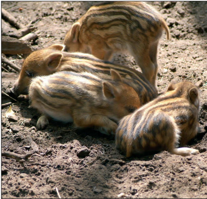
Abb. 2: Bachen führen oft acht Frischlinge und mehr.

zwei Stunden. In einem nächsten Schritt werden die Praktiker im Rahmen einer schriftlichen Befragung interviewt.