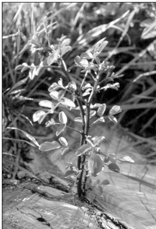
Abb. 4: Robinienstockausschlag

Grenzen ihres natürlichen Areals oder bei der Besiedelung von Grenzstandorten, in den Vordergrund. Dies ermöglicht ihnen ein Beharren und Ausbreiten am jeweiligen Standort. Es erschwert aber eine mechanische Kontrolle, da sie auf Abschneiden und Verletzungen mit Ersatztriebbildungen und verstärktem klonalem Wachstum reagieren. Dank der Symbiose mit Rhizobium-Bakterien besitzt die Robinie zudem die Fähigkeit, Luftstickstoff zu binden. Dies ermöglicht ihr auf armen Böden rasches Wachstum, führt aber auch zu unerwünschten Vegetationsveränderungen (z. B. auf Magerasen) (KOWARIK 2003). Bestimmte Eigenschaften, wie eine lange Lebensdauer von Samen im Boden oder vegetatives Regenerationsvermögen, komplizieren eine gezielte Steuerung der Bestände und schränken Bekämpfungsmöglichkeiten und -erfolge ein. Hier ist eine Bewertung des jeweiligen Einzelfalls sinnvoll. Können waldbauliche Maßnahmen, z. B.