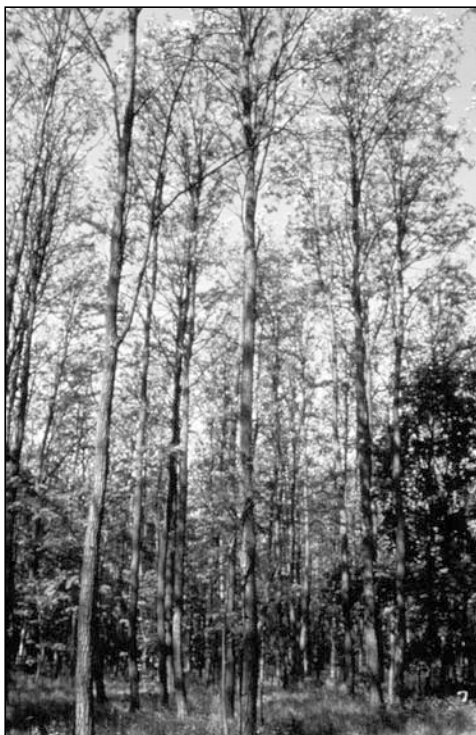
Abb. 3: Schiffsmastrobinien

Interessanterweise tritt die vegetative Vermehrung bei Pflanzen unter ungünstigen Lebensbedingungen, z. B. an den