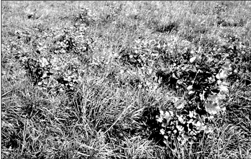
Abb. 1: Frische Wurzelbrut von Pappelhybriden