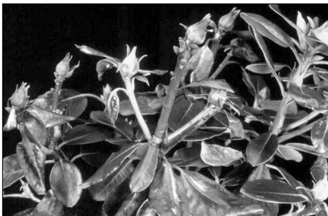
Abb. 1: Phytophthora ramorum an Knospen und Blättern von Rhododendron

In Deutschland wurde Phytophthora ramorum insbesondere aus abgestorbenen Trieben und Blattflecken von Rhododendronpflanzen sowie aus Stammnekrosen von Schneeball-Sträuchern isoliert (WAGNER & WERRES 2003). So stammt auch der bisher einzige Fund in Bayern aus dem Jahr 2002 von Rhododendronpflanzen aus einer Baumschule (BÜTTNER mündl. Mittl. 2004). Da es zwischen den europäischen Isolat und dem Erreger des „Sudden oak death“ in Kalifornien genetische Unterschiede gab, hoffte man, dass der Erreger die heimischen Waldbäume verschonen würde.