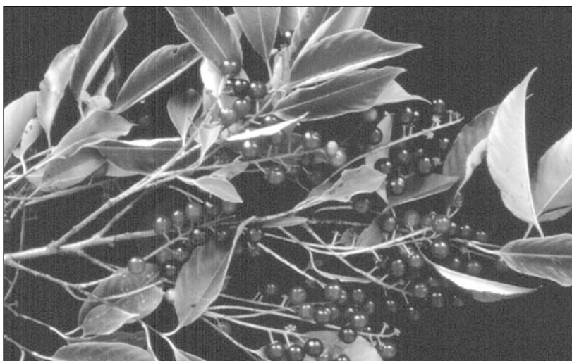
Abb. 1: Prunus serotina – Zweig mit Früchten

In anderen Bereichen ihres Vorkommens in Deutschland, z. B. im Käfertaler Wald bei Mannheim, versucht man einen anderen Weg zu