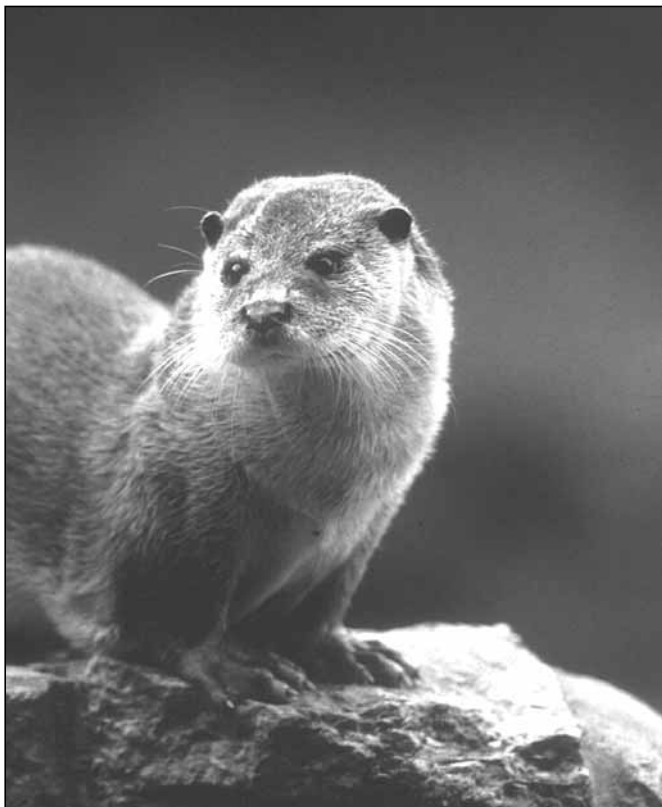
Abb. 1: Fischotter ( Lutra lutra )

Seit Gründung des Nationalparks im Jahre 1970 wird die Entwicklung des Fischotterbestandes in regelmäßigen Abständen im Rahmen gezielter Studien kontrolliert. Zufallsbeobachtungen von Mitarbeitern der Nationalparkverwaltung ergänzen die dabei erhobenen Daten. Im Rahmen des vorgestellten Projektes wurden im gesamten Nationalparkgebiet (ca. 240 km 2 ) 13 Fließgewässer und zwei Triftklausen genau überprüft und aus den erhobenen Daten Rückschlüsse auf die Bestandsentwicklung gezogen. Darüber hinaus wurden 200 Losungen auf Nahrungsreste untersucht sowie das Geschlecht der Fischotter auf Basis von Hormonbestandteilen in den Sekreten bestimmt.