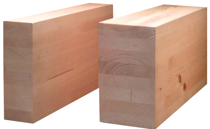
Abbildung 1: Brettschichtholz mit gleicher Tragfähigkeit: Buche (links) und Fichte (rechts)

Ein wirtschaftlich interessantes, aber bisher unerschlossenes Gebiet ist die Verwendung für tragende Bauteile im Hochbau. Buchenholz hat hier auf Grund seiner im Vergleich mit Nadelholz wesentlich höheren Festigkeitswerte ein großes Potential. Daher wurde seit den 1960er Jahren immer wieder vorgeschlagen, Brettschichtholz (BSH) vollständig aus hochfesten Laubhölzern herzustellen oder BSH aus Nadelholz mit solchen gezielt zu verstärken (Egner und Kolb 1966; Gehri 1985; Frühwald et al. 2003). Mit einigen wenigen hochfesten Buchenholzlamellen im Biegezug- und Biegedruckbereich sowie einem Kern aus Fichtenlamellen können hochfeste Buche-Hybridträger produziert werden (Blaß und Frese 2006). Mit BSH-Trägern aus Buchenholz bzw. Buche-Hybridträgern lassen sich ohne Einbußen bei der Tragfähigkeit und Gebrauchs-