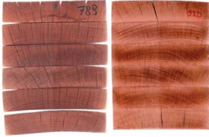
Abbildung 3: Prüfkörper nach der Delaminierungsprüfung; links: Fugen wurden bereits kurz nach dem Leimauftrag verpresst; rechts: Die Fugen wurden erst nach längerer Wartezeit verpresst.