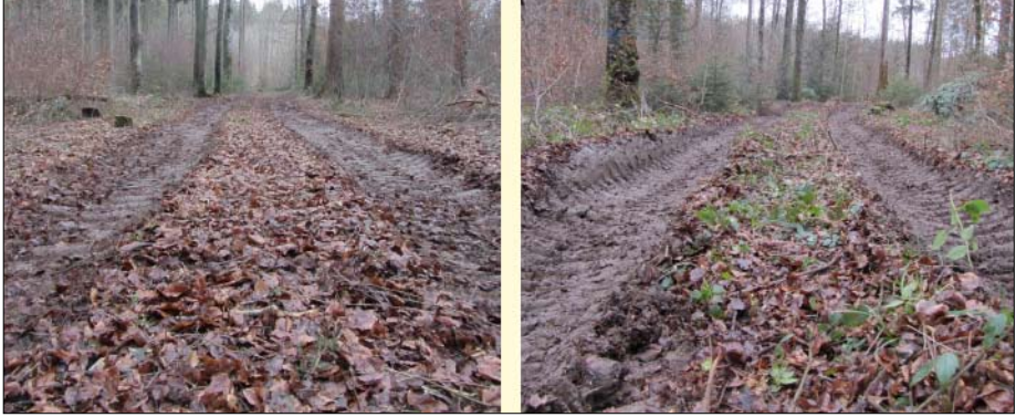
Abb. 3: Fahrsporausprägung bei 1,8 bar (links) und 4,0 bar Reifeninnendruck. Bodenfeuchte 36 %.

Mal mit dem voll beladenen Forwarder (Gesamtgewicht 27,5 t) befahren. Die bodenphysikalische Auswertung der Untersuchung lag bei Redaktionsschluss des Tagungsbandes noch nicht vor. Allerdings war schon optisch zu erkennen, dass es bei niedrigem Druck zu einer deutlich geringeren Spurtiefe kommt (Abb. 2). • Statische Messungen der Aufstandsfläche auf Asphalt ergaben bei Absenken des Reifeninnendrucks von 4,0 auf 1,8 bar eine Vergrößerung der Aufstandsfläche um 30 %.