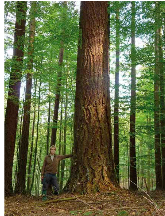
5 Douglasien müssen nicht immer so stark werden wie diese in der Abteilung Mainz im Spessart. Schon im 60-jährigen Umtrieb oder als Mischbaumart im Buchenbestand überzeugt die Douglasie hinsichtlich ihrer Ertragslage.

Die baumartenbezogenen Modellkalkulationen sind kein Waldbaukonzept, sie bieten lediglich eine Orientierung aus