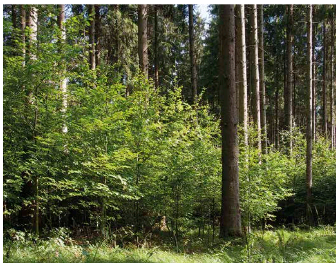
2 Buchen-Naturverjüngung kostet nicht viel. Damit gewinnt die Buche gegenüber der Fichte einen Vorteil.

Der Vergleich der Baumarten im Rahmen einer Forstwirtschaft mit Kunstverjüngung benachteiligt systematisch die Buche und die übrigen Mischbaumarten. Diese könnten im Naturverjüngungsbetrieb weit kostengünstiger begründet werden. In der Praxis verhinderte dies generationenlang auf großer Fläche ein zu hoher Schalenwildeinfluss. Die betriebswirtschaftlichen Chancen einer Naturverjüngungswirtschaft mit leistungsfähigen Mischbeständen aus Fichte, Tanne und Buche (Edellaubholz) wurden dadurch nicht gesehen oder unbewusst verdrängt. Der Vergleich wird umso deutlicher, wenn die in Fichtenreinbeständen häufiger eintretenden Schäden durch Sturm, Schnee und Borkenkäfer ehrlich berücksichtigt werden. Für die Verwertung des Zwangsanfalls können nur die dann erzielbaren Kalamitätspreise angesetzt werden. Im Extrem haben gerade nicht wenige kleinere Waldbesitzer seit jeher einen hohen Anteil ihres Holzeinschlags als Kalamitätsnutzung vermarktet. Ein »aussetzender Betrieb« dieser Art war und ist kein Erfolgsmodell. Wenn die Schäden regelmäßig früh eintreten, steigen zudem die Kosten für die dann häufigere Bestandsgründung und Jugendpflege.