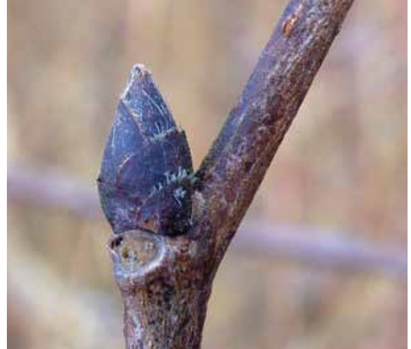
Abbildung 5b: Im Unterschied zur Flatterulme sind die Knospen von Feld- (hier im Bild) und Bergulme eiförmig und einfarbig dunkelbraun

Die Kronenarchitektur aller Ulmen ist wesentlich durch die strikt zweizeilige Stellung von Blättern und Knospen (Abbildung 3) bestimmt. Deshalb verzweigen sich auch alle Triebe, selbst aufrecht wachsende Leittriebe, regelmäßig zweizeilig. Auf diese Weise entstehen die für Ulmen typischen fächerartigen, eine Ebene bildenden Zweigsysteme, bei denen die Seitentriebe auf zwei Seiten der Tragachse gleich einer einholmigen Leiter sprossenartig übereinander angeordnet sind (Abbildung 4, Bartels 1992).