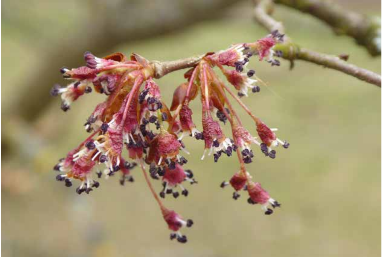
Abbildung 10: Blütenstand der Flatterulme, der wegen der lang gestielten Einzelblüten »flattrig« wirkt

glichen mit Berg- und Feldulme bei der Flatterulme geringer, so dass sie auch Sand- und Bruchwaldstandorte besiedeln kann.