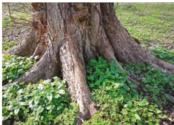
Abbildung 9: Stammfuß einer Flatterulme in einem Auwald. In der Krautschicht Gefleckter Aronstab ( Arum maculatum ) und Buschwindröschen ( Anemone nemorosa )

In Deutschland ist die Flatterulme sehr selten. Zudem war und ist sie weder von der Forstwirtschaft noch in der Landschaftspflege besonders geschätzt und wurde deshalb kaum waldbaulich gefördert. Sie kommt vor allem in den Niederungen größerer Flüsse wie Rhein und Main, Donau, Elbe und Oder vor. In den ausgedehnten Tieflagen Ostdeutschlands ist sie häufiger als in den westlichen und südlichen Bundesländern, wo ihre Verbreitung größere Lücken aufweist. Insbesondere