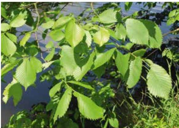
Abbildung 7 (unten): Typisch für das Laubblatt der Flatterulme ist, dass die Zähne am Blattrand deutlich nach vorne gekrümmt und die relativ dicht stehenden Seitenerven zum Blattrand hin nicht oder kaum gegabelt sind. Wie bei allen Ulmen ist der Blattgrund an der Basis deutlich asymmetrisch