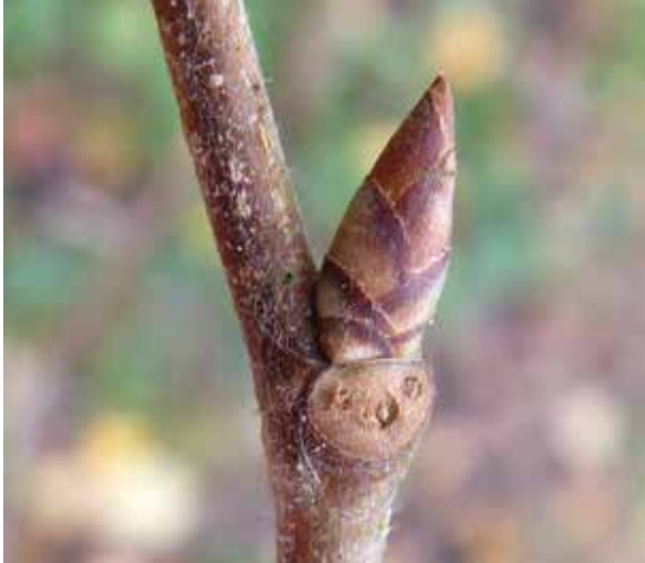
Abbildung 5a: Gut zu bestimmen ist die Flatterulme an ihren deutlich zugespitzten Knospen mit hellbraunen, am Rand dunkleren Schuppen