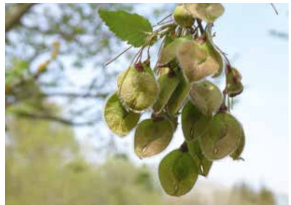
Abbildung 11: Fruchtstand der Flatterulme ( Anemone nemorosa )

Die Früchte sind wie bei anderen Ulmenarten bis zur Reife grün und tragen vor dem Laubaustrieb zur