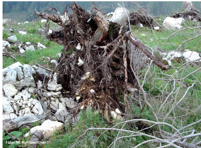
Abbildung 2: Bei Katastrophenereignissen im Kalkalpin wird oft der blanke Fels freigelegt.

Nach Katastrophenereignissen sind anfängliche Nährstoffverluste unvermeidlich. Diese Nährstoffverluste können reduziert werden, indem Schlagabraum sowie möglichst viel Totholz auf der Fläche liegenbleibt, sofern das aus Waldschutzgründen (Borkenkäfer) und verkehrssicherungstechnisch vertretbar ist. Zusätzlich dient diese Maßnahme dem Humusschutz und es werden dadurch günstige Kleinstandorte für die natürliche und künstliche Verjüngung geschaffen. Bei Pflanzungen sollten alle Bergmischwaldbaumarten, besonders aber Pionierbaumarten inklusive Lärche und Kiefer, berücksichtigt werden. Letztere bilden wegen ihres auch auf Freiflächen guten Jugendwachstums relativ rasch einen lockeren Vorwald, in dessen Schutz sich die Schlusswaldbaumarten besser entwickeln können. Wichtig ist bei der Pflanzung eine sorgfälti-