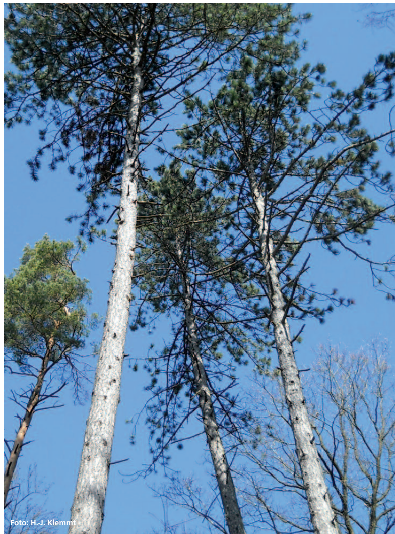
Abbildung 1: Blick in den Kronenraum eines Schwarzkiefern-Kiefern-Buchenbestandes bei Schernfeld (AELF Ingolstadt). In diesem Bestand wird derzeit die Anlagemöglichkeit von waldbaulichen Beobachtungsflächen bzw. die Durchführbarkeit von Stammanalysen geprüft, um neue Erkenntnisse zum Wachstum dieser Baumarten in Mischung in Bayern zu erlangen.

Mayer (1984) stellt internationale Vergleichszahlen zum Wuchs zwischen den Varietäten bzw. zwischen Schwarzkiefer und Gemeiner Kiefer ( Pinus sylvestris ) dar: »Die langlebige Schwarzkiefer (434–584 Jahre, Tschermak 1950) ist auf natürlichen Reliktbeständen geringwüchsig (150–200 Jahre, 5–10m hoch, 100 Vfm, 0,5–1,0 Vfm dGZ); natürliche Randvorkommen sind wüchsiger (240–300 Jahre, 28–30m Höhe [...]), Schwarzkiefernurwald an der Drina mit Spitzenleistungen (150jährig, 45–49m hoch, 600–800/1000 Vfm). Auf besseren Standorten mit 120 Jahren 30m, 450 Vfm, 7 Vfm DGZ. Die Volumenleistung ist im Vergleich zu Waldkiefer 10–20% höher durch die größere Stammzahl (vollholziger, länger anhaltender Zuwachs[...]). Bei einem mittelfranzösischen Anbauversuch [...] erzielte die Waldkiefer mit 125 Jahren 25,4m Mittelhöhe, corsicana- und calabrica-Herkunft dagegen 30,6 bzw. 33,5m; noch größerer Unterschied beim Vorrat: Waldkiefer 434 Vfm, Schwarzkiefer 639 bzw. 1200 Vfm. Die DGZ-Leistung betrug bei der kalabrischen Herkunft 10–11 fm (75 Jahre), bei der korsischen 7–8 fm, Waldkiefer 5–6 fm [...]«. Dieses Literaturzitat verdeutlicht zwei grundlegende Probleme beim Vergleich der Wuchsleistungen: Zum einen unterscheiden zahlreiche wissenschaftliche Arbeiten nicht zwischen den provenienzbedingten Wuchsunterschieden, zum anderen folgen die zahlenmäßigen Beschreibungen der Wachstumsgänge bzw. Wuchsleistungen häufig nicht waldwachstumskundlichen Standards (Johann 1993).