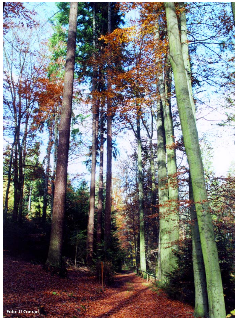
Abbildung 1: Geastete Altdouglasien in einem Buchenbestand. Für die Erzeugung von Wertholz ist häufig die Astung unerlässlich.