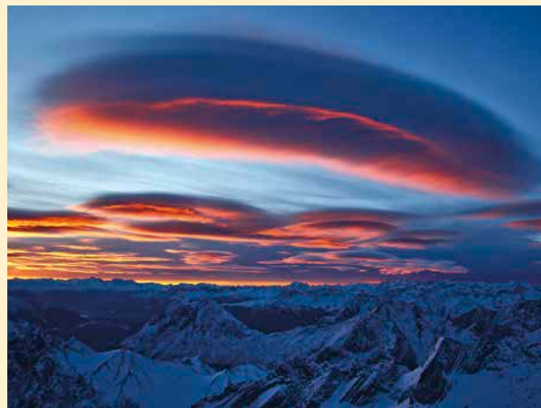
Blick vom Wendelstein (1838 m) nach Süden

Föhn sorgte im November 2016 nicht nur an einigen Orten im Alpenvorland für Lufttemperaturen bis zu über 20^\circ\text{C} , sondern auch für ungewöhnliche Wolken am abendlichen Alpenhimmel. Diese typischen schmalen, fischförmigen Wolken werden auch Altostratus lenticularis genannt.