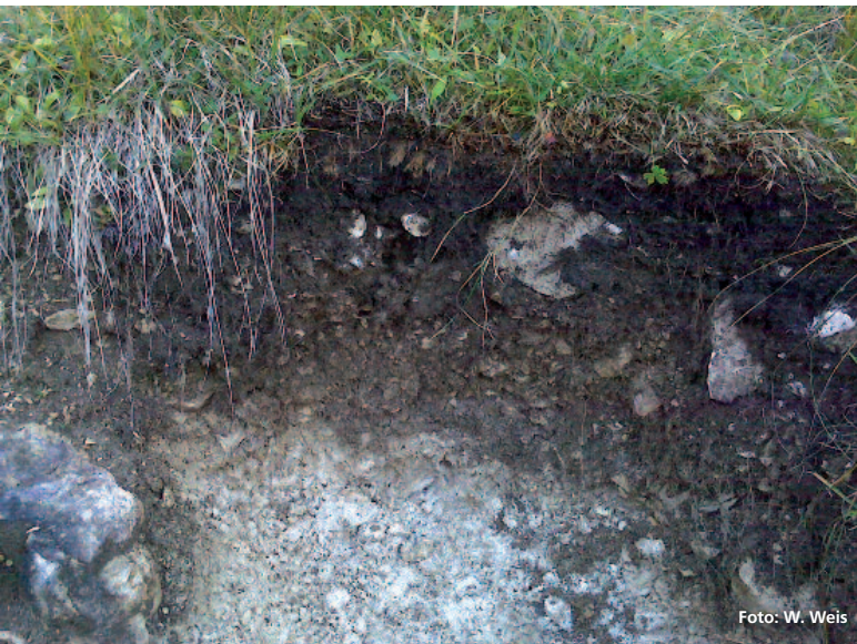
Abbildung 4: Flachgründige, skelettreiche Böden wie diese Rendzina auf Dolomitgrus sind gegenüber Biomasse- und Nährstoffentzug besonders anfällig.

Wurzelraum der Bäume häufig eingeschränkt, Wasser und Nährstoffe werden zu großen Teilen aus der organischen Auflage gewonnen. Humusaufbau schafft hier direkt ein Mehr an Wurzelraum. Zusätzlich wird beim Verzicht auf Kronennutzung das Nährstoffangebot erhöht, ein Aspekt, der auch für Böden von entscheidender Bedeutung ist, die zwar tiefgründig und gut durchwurzelbar sind, wo aber bereits das Ausgangsmaterial nur wenige Nährstoffe enthält. Geordnet nach ihrer Anfälligkeit gegenüber Kronennutzung (in absteigender Reihenfolge) sind folgende Standortstypen zu nennen: