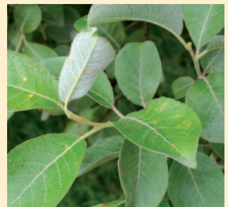
Abbildung 1: Freistehende Salweide in der Feldflur (li), männliche Blüten (Mitte), Blätter (re.)