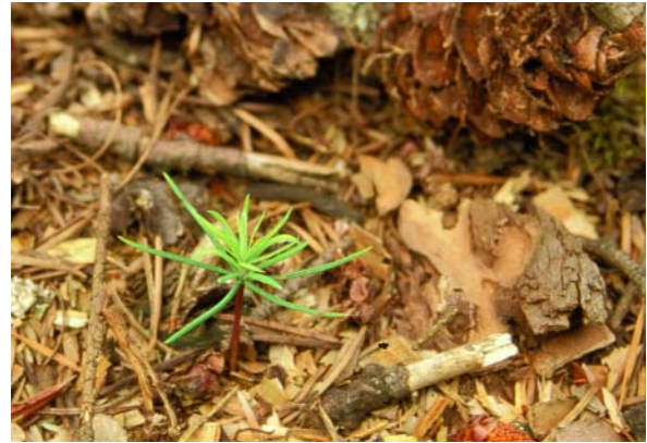
Abbildung 3: Douglasienkeimling

Bürger-Arndt (2000) schließt aus der Auswertung verschiedener Arbeiten, dass die Entwicklung der Bodenvegetation unter Douglasie maßgeblich vom Unterschied des Lichtangebotes gegenüber dem jeweiligen natürlichen Vergleichsbestand abhängt und sich daher mit forstlichen Eingriffen steuern lässt.