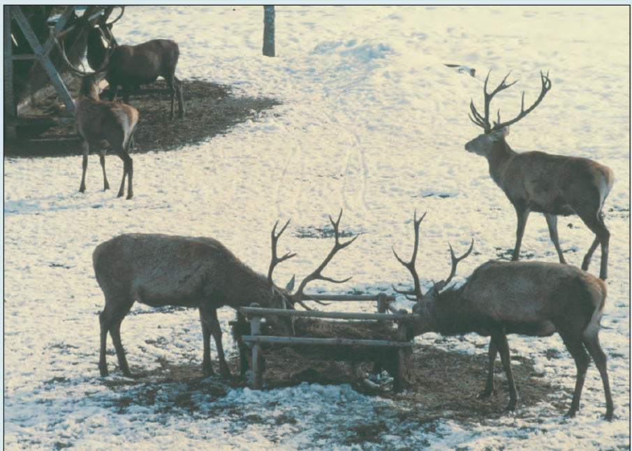
In der Schaufütterung der BaySF am Spitzingsee können Kinder und Erwachsene während der Wintermonate Rotwild aus nächster Nähe beobachten.