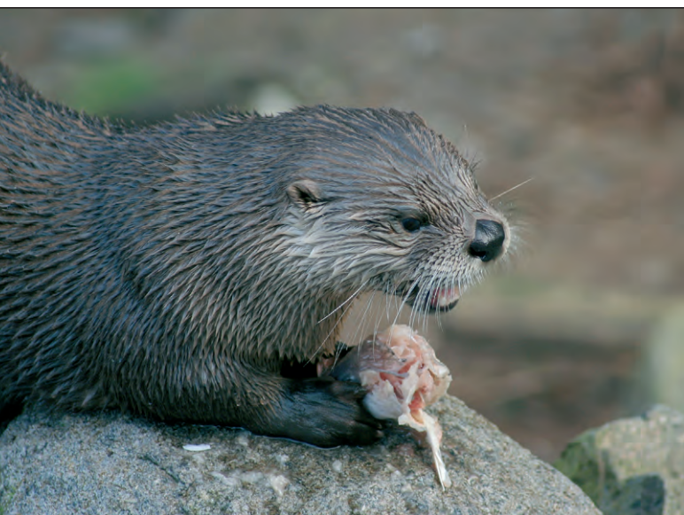
Abb. 1: Fischotter breiten sich vor allem im ostbayerischen Grenzgebiet wieder stärker aus. Konflikte mit Teichbesitzern und Fischern werden daher zunehmen.

Wer Nahrung nutzt, die auch dem Menschen schmeckt und in dessen intensiv genutzter Kulturlandschaft lebt, hat es nicht leicht. Dieser Konflikt um Lebensraum und Beutetiere gereichte dem Fischotter schon beinahe zum Aussterben. Im Bayerischen Wald entlang der Grenze zu Tschechien überlebte die Art. Seit einigen Jahren breitet sich der Fischotter erfreulicherweise wieder aus. Nun stellt aber seine Rückkehr vor allem Angler und Teichwirte vor die Herausforderung, mit ihm wieder leben zu lernen. Menschen und Fischotter müssen also wieder teilen, nicht nur die Beutetiere, auch den Lebensraum. Da Teilen bekanntlich immer schwer fällt, bleiben Konflikte nicht aus. Mit einem integrativen Ansatz wird nun die Bayerische Landesanstalt für Wald und Forstwirtschaft (LWF) Grundlagendaten erheben, um zur Lösung der bestehenden Konflikte beizutragen. Im Mittelpunkt stehen Fischotter und Mensch gleichermaßen.