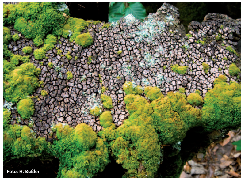
Abbildung 1: Der Mosaik-Schichtpilz Xylobolus frustulatus stellt einen besonders hohen Anspruch an Totholz. Der Pilz benötigt starkes Eichentotholz und ist gerade in den Eichenfurnierbeständen des Spessarts regelmäßig anzutreffen.

Auf der Grundlage verschiedener Kartierungsprojekte (Krieglsteiner 1991; Krieglsteiner 1999; Krieglsteiner 2004; Schilling 2009) und den Kartierungsdaten der Bayerischen Landesanstalt für Wald und Forstwirtschaft aus den bayerischen Natur-